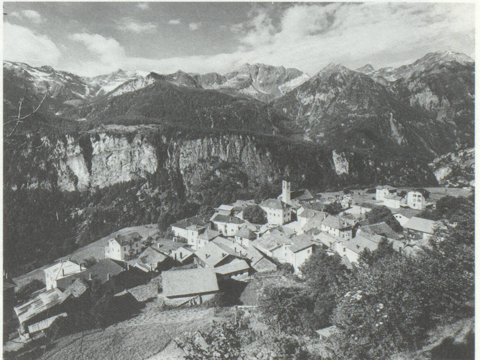
Osco (Valle Leventina)

Or nos centres touristiques ne sont pas encore équipés pour accueillir tout ce monde motorisé, malgré les efforts mis en œuvre ces dernières années. De nouvelles routes ont été ouvertes (comme les accès à Locarno et à Ascona), la circulation urbaine a été