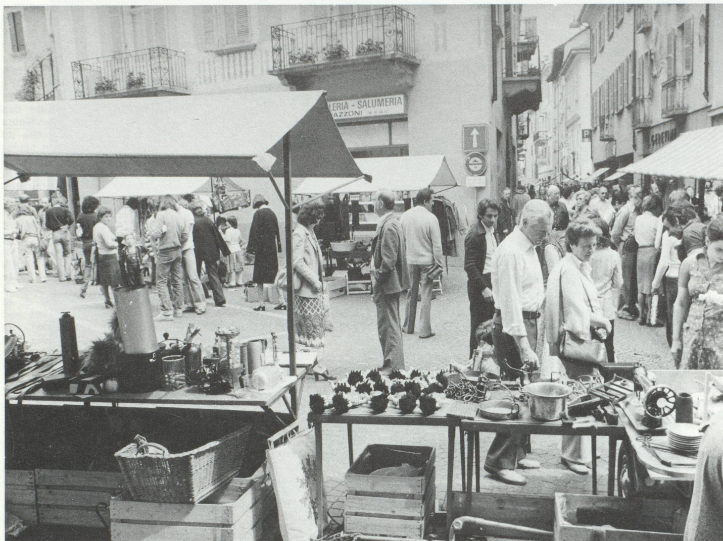
Locarno : le marché aux puces dans la vieille ville

des vallées tessinoises et, donc, être vraiment utiles au développement harmonieux des communautés locales, au maintien de leur autonomie, au renforcement réel de leur liberté et de leur autogestion. Je sais qu'il n'est pas facile de mettre un frein aux rêves trop ambitieux, surtout quand ils justifient un espoir parfaitement légitime d'améliorer un sort jusqu'ici ingrat. Mais je maintiens qu'il importe que les vallées demeurent en premier lieu à la disposition de leurs habitants, donc à la mesure de leur capacité autonome à les gérer.