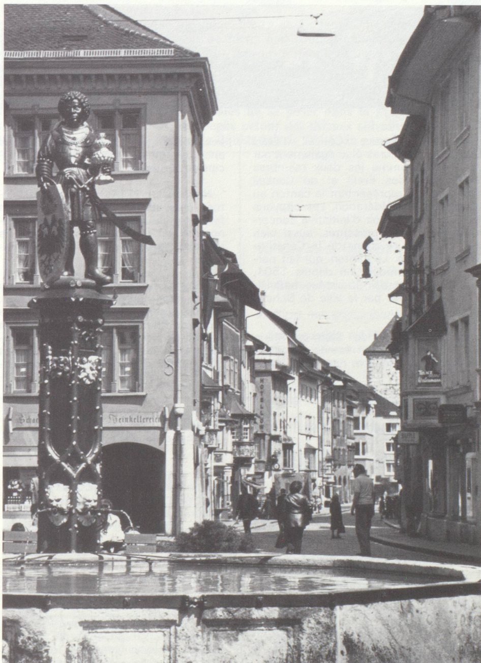
Vieille ville de Schaffhouse avec la fontaine du More.

Le canton est divisé en 6 districts, comprenant 35 communes. La Constitution cantonale date de 1876. L'autorité législative (Grand Conseil) se compose de 80 membres, élus par les citoyens, pour une durée de quatre ans.