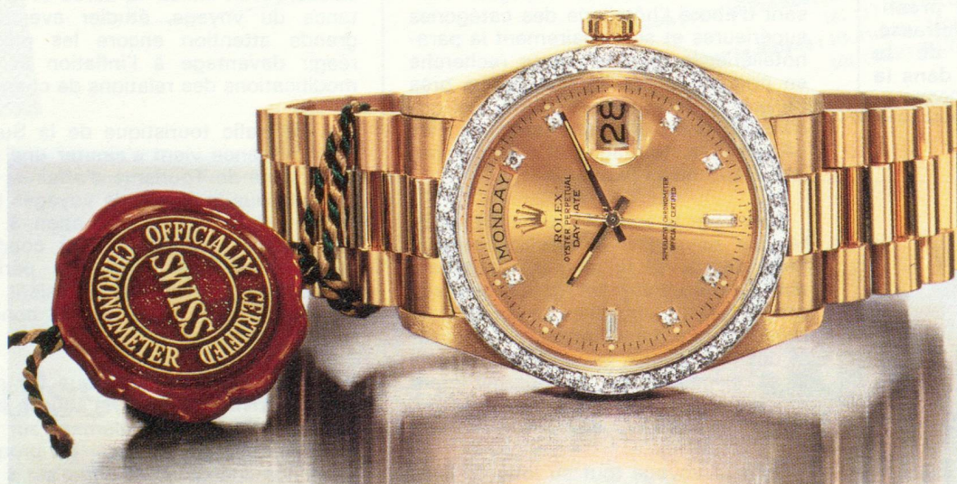
La Rolex Day-Date, sertie de diamants, bracelet Président. Disponible en or ou en platine. Documentation sur demande à SAF des Montres Rolex, 10 avenue de la Grande-Armée, 75017 Paris.

Une Rolex mérite le prestige dont elle jouit.