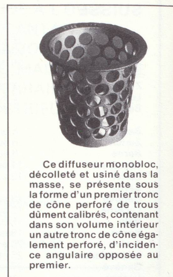
Ce diffuseur monobloc, décollé et usiné dans la masse, se présente sous la forme d'un premier tronc de cône perforé de trous dûment calibrés, contenant dans son volume intérieur un autre tronc de cône également perforé, d'incidence angulaire opposée au premier.

véhicules à essence commercialisés en Europe; qu'il s'agisse de modèle simple ou de carbureteur double corps. Dans ce dernier cas, il vous faut deux ES.22.