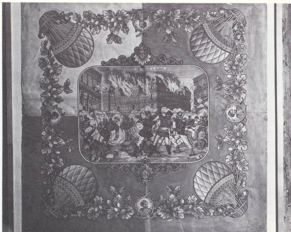
Projet d'une toile glaronnaise illustrant l'insurrection de la Commune de Paris lors de la « semaine sanglante » de mai 1871 (Photo : J. Davatz, Mollis).

Si la Réforme ne réussit pas à supprimer les capitulations et le mercenariat, elle eut néanmoins pour effet d'en éloigner les réformés, qui trouvaient plus d'attraits que les catholiques dans les professions industrielles et commerciales. La connaissance des besoins et des gens des pays étrangers, acquise par le service militaire, a peut-être contribué en partie au succès de l'industrialisation glaronnaise. C'est grâce à cette connaissance que nous avons pu plus tard tourner le dos au Service étranger : Glaris réformé put se permettre de ne pas renouveler l'alliance avec la France en 1723. A cette époque, la filature avait déjà pris un grand essor !