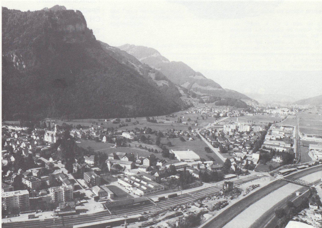
La plaine de la Linth : région à forte densité de population et hautement industrialisée.

Le Conseil d'État dispose d'un délégué au développement économique qui est, à tous égards, à la disposition de ceux qui s'intéressent à un emplacement dans le canton de Glaris, et qui coordonne les intérêts et les besoins des entreprises désirant s'implanter ou se transplanter sur son territoire. De toute façon, l'idée de faire des investissements dans le canton de Glaris est à retenir.