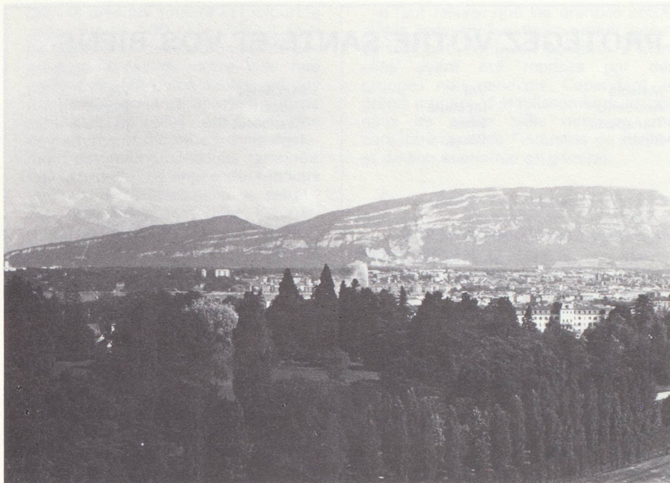
Campagne genevoise. Au fond : le mont Salève.

plus marquée à Genève que dans le reste de la Suisse. Le rôle de Genève et la place qu'elle occupe sur le plan international, de même que sa tradition commerciale et financière ne pouvaient qu'accélérer fortement cet essor du tertiaire, qui est indiscutablement la source la plus importante du développement de l'économie genevoise.