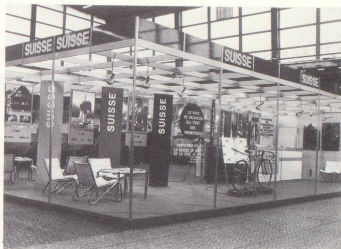
Vue partielle du stand officiel suisse à la Foire Internationale de Paris 1981.