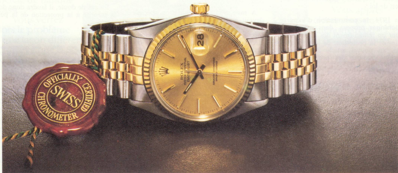
La Rolex Datejust. Documentation sur demande à SAF des Montres Rolex, 10 avenue de la Grande-Armée, 75017 PARIS.

Une Rolex mérite le prestige dont elle jouit.