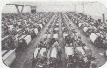
Salle de tissage équipée de machines à tisser à navettes, type Riiti-C1000

Livrer seulement des machines-outils, des machines textiles ou des installations de fonderie ne serait que besogne faite à moitié. Ce que nous fournissons, c'est le savoir qu'il faut pour les mettre en œuvre. Ce que nous fournissons, ce sont des études du marché et de la demande, des solutions du financement et des approvisionnements. Et enfin, la mise en route ainsi que l'entraînement et l'éducation du personnel.