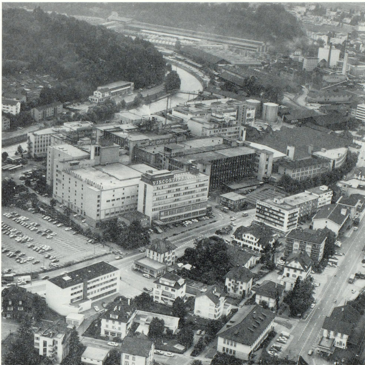
Vue générale de l'usine d'Emmenbrücke

Quelques mots encore à la question : « Quelle importance possède Viscosuisse en Suisse » — Pour la Suisse centrale, encore peu développée industriellement au début de ce siècle, sa fondation a apporté un nouvel élan à la région. La Commune d'Emmen par exemple s'est développée dans les dernières 70 années de 3 200 habitants à 22 000 habitants. Plusieurs communes de la région ont de même profité de cette lancée économique. Viscosuisse, le plus grand employeur de la région, a apporté sa part à ce développement. Sa direction a eu toujours une grande liberté dans la gestion de l'entreprise et l'a utilisée pour établir la société comme facteur de l'économie suisse. Des institutions sociales exemplaires, de bonnes relations avec les autorités communales, cantonales et fédérales