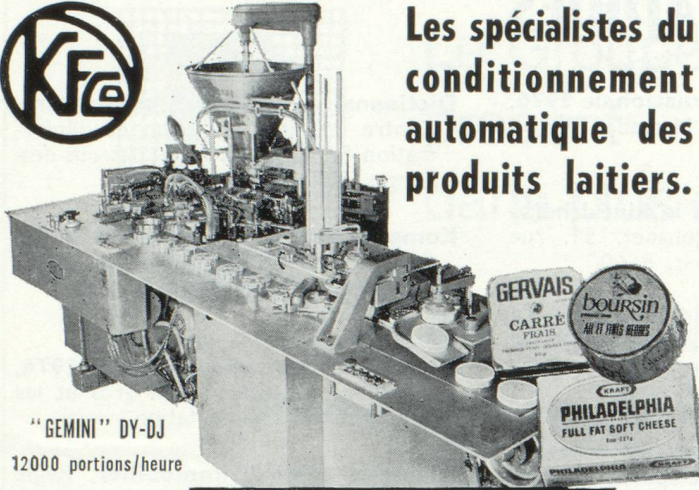
"GEMINI" DY-DJ 12000 portions/heure

Les spécialistes du conditionnement automatique des produits laitiers.