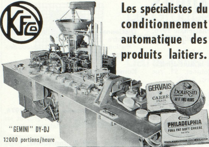
"GEMINI" DY-DJ 12000 portions/heure

Les spécialistes du conditionnement automatique des produits laitiers.