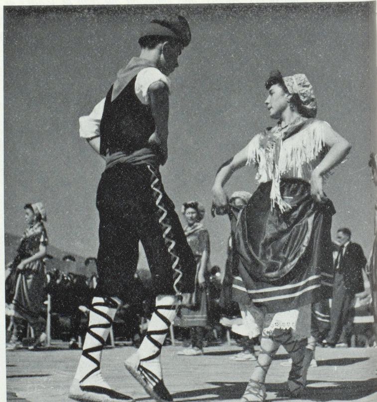
Pyrénées orientales Danse du Breton