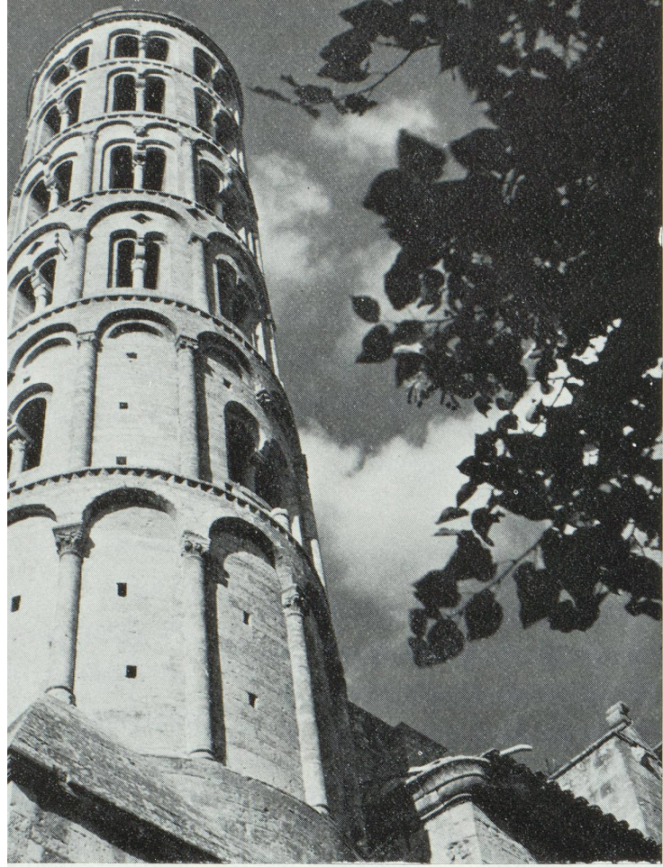
La Tour Fenestrelle de l'Église Saint-Theodoret