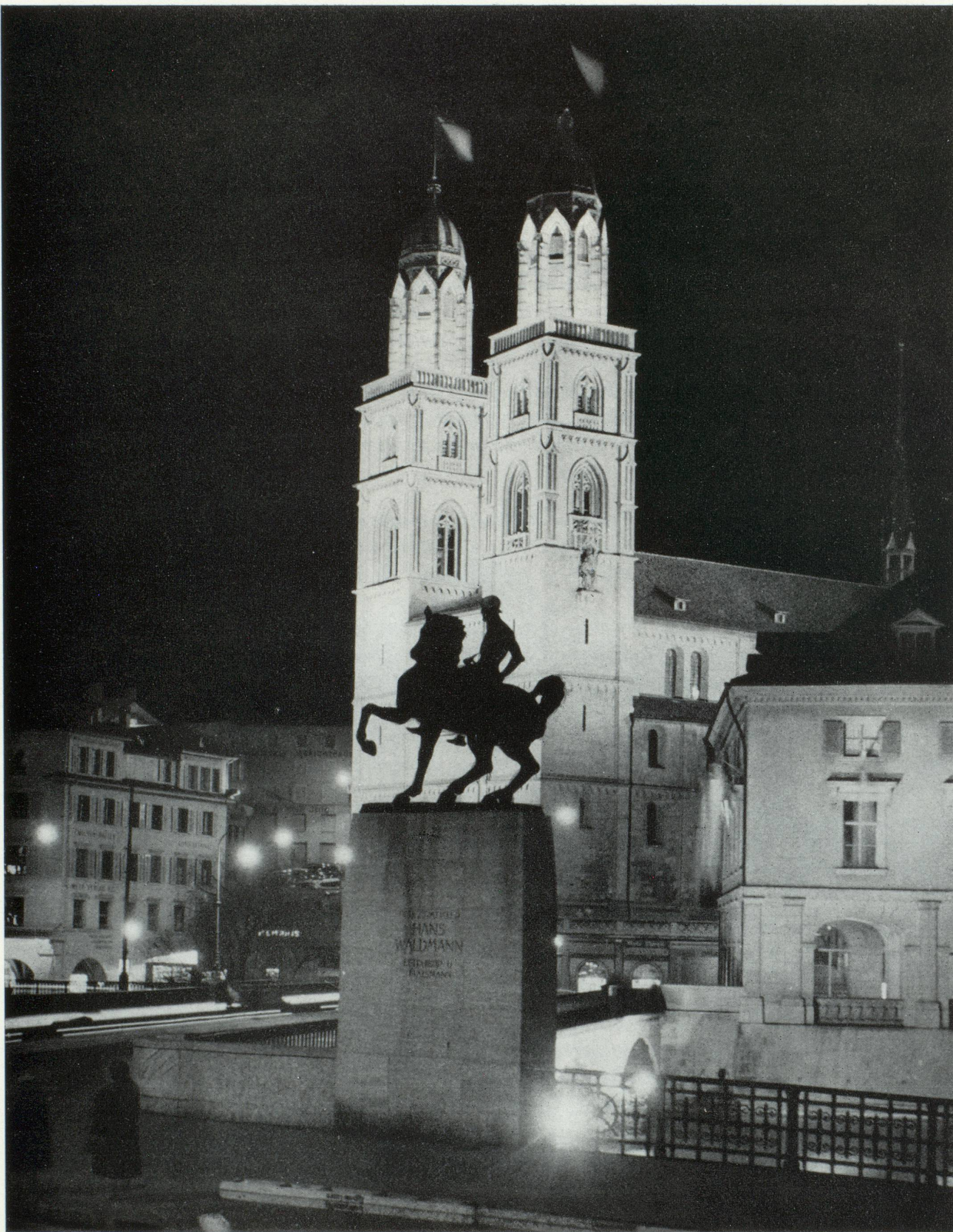
Monument Hans Waldmann avec Grossmunster