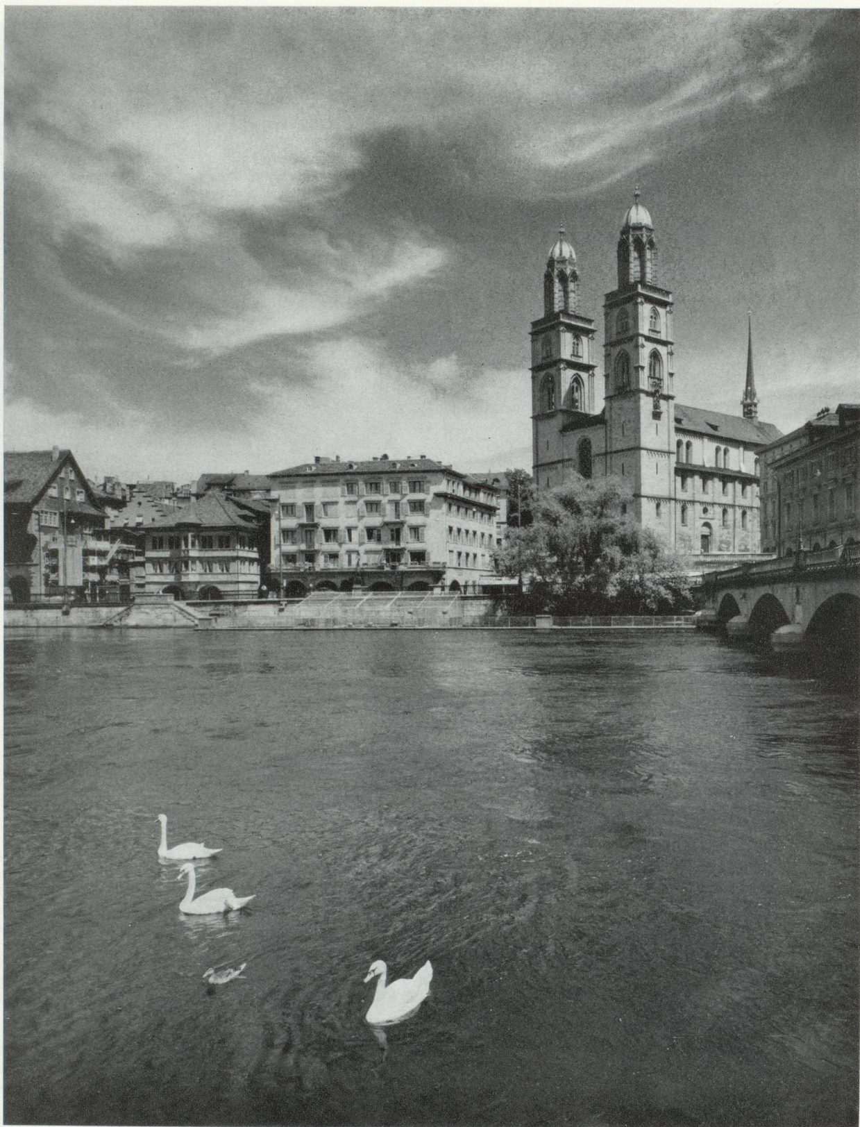
La Limmat avec le Grossmünster

Les photos illustrant les articles sur Zurich ont été aimablement mises à notre disposition par le Syndicat d'Initiative de Zurich