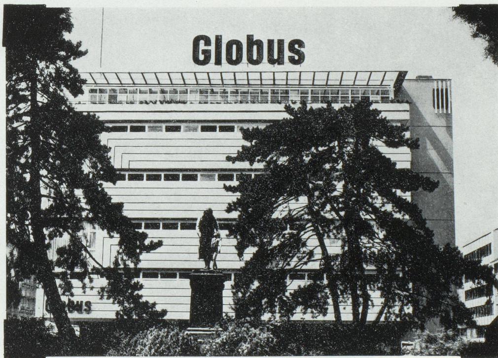
Qui n'a pas vu le nouveau Globus à Zurich, n'a pas vu Zurich !

Il est curieux de constater que tous les projets en cours ne portent que sur des établissements de premier rang, et aucun sur des hôtels de deuxième rang. Il nous semble donc nécessaire que la ville fasse un effort pour que soient mis à disposition, tôt ou tard, des lits d'hôtels à meilleur marché, ceci par l'accord de facilités administratives ou par l'attribution de terrains adéquats. En unissant ses forces, Zurich donnera à son appareil touristique l'essor correspondant au développement général de son économie.