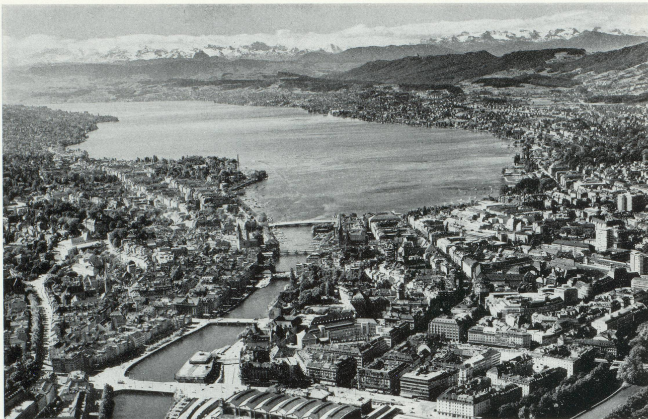
Le centre de la ville avec le lac