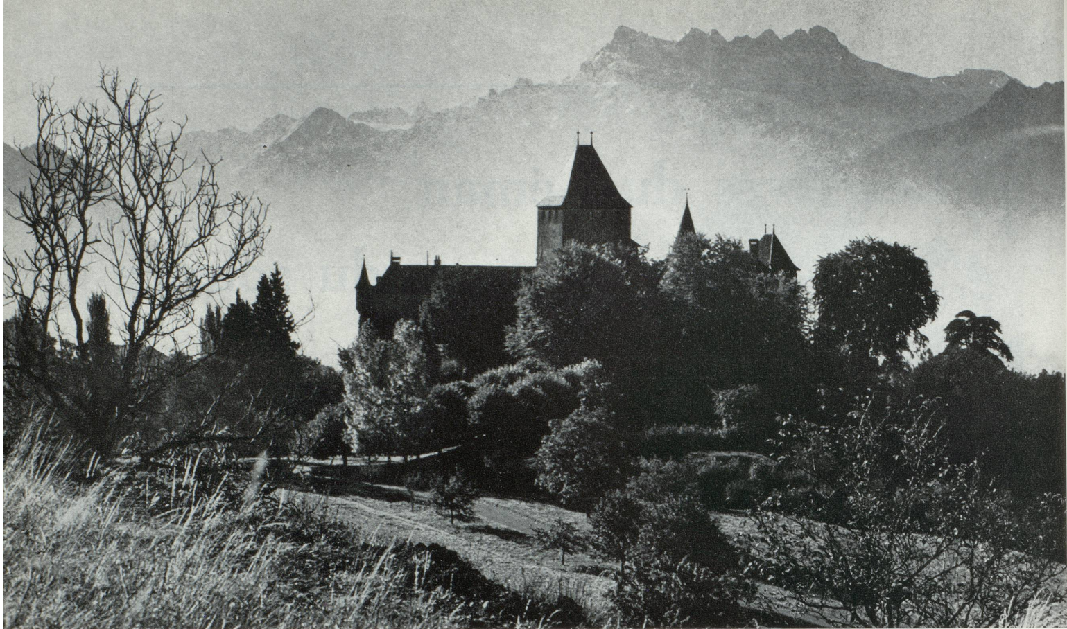
Château de Blonay.