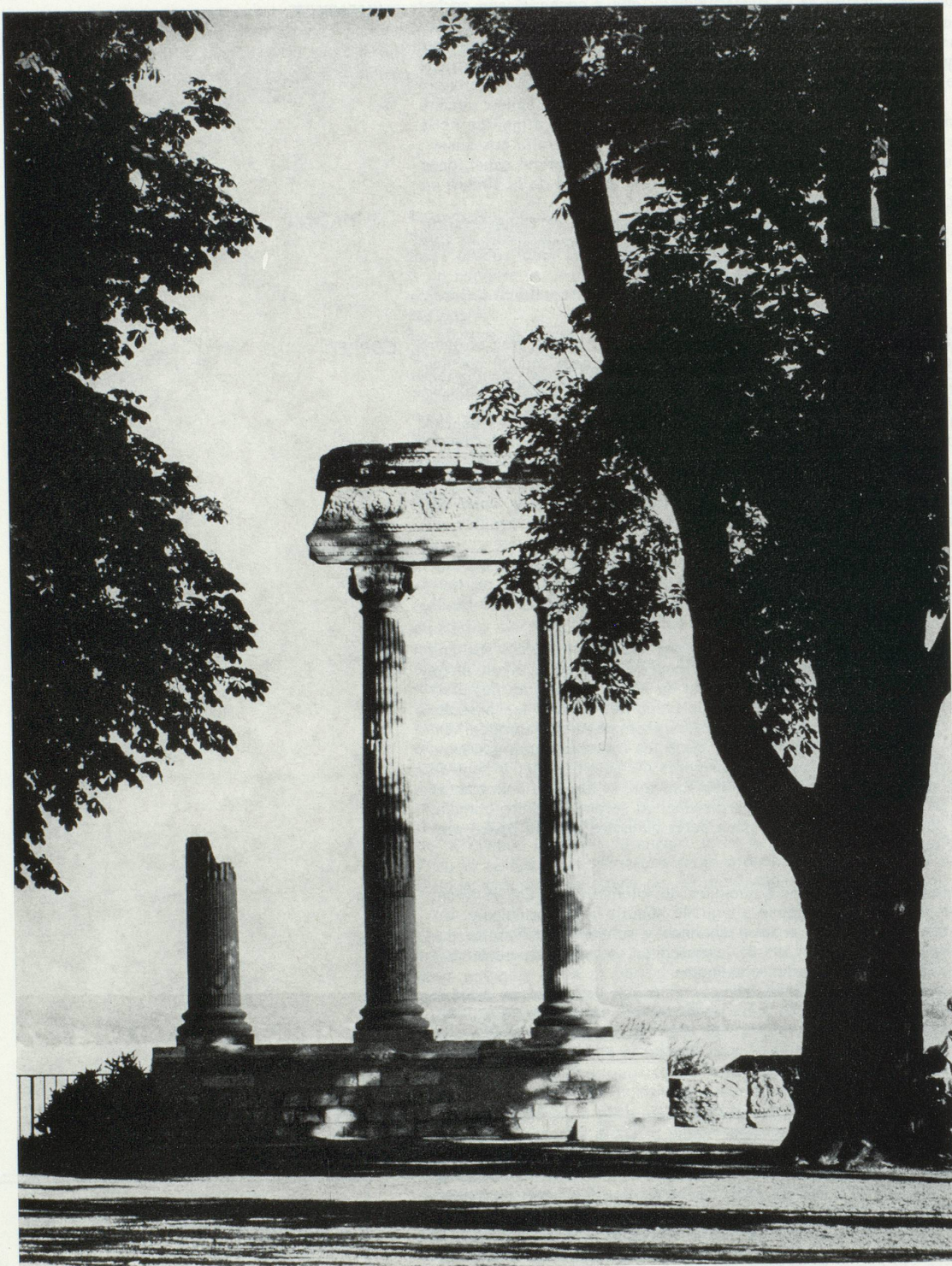
Nyon : les colonnes romaines.