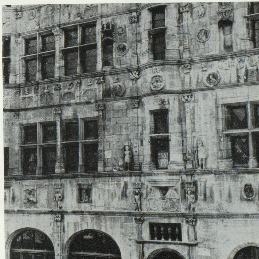
Paray-Le-Monial : l'Hôtel-de-Ville.