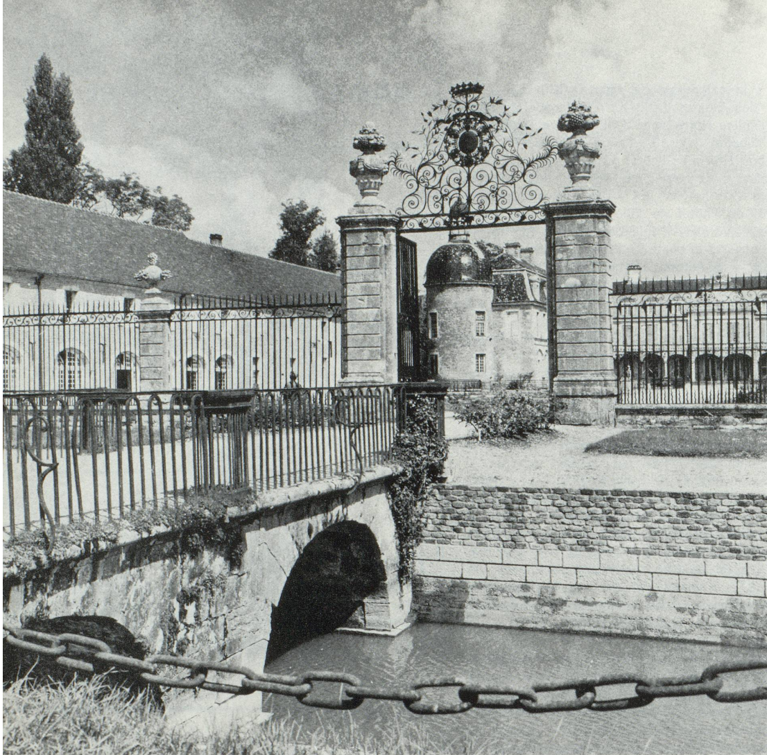
Le château de Pierre (1680).