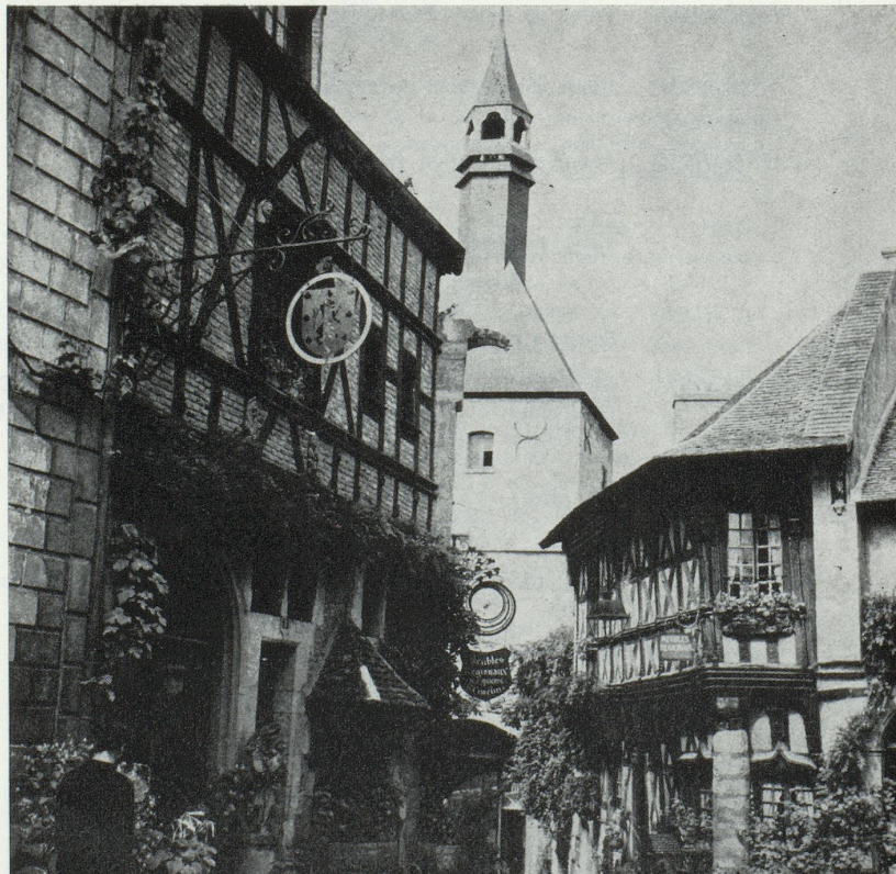
A Bourbon-Lancy, la Tour de l'Horloge, la porte fortifiée d'une maison de bois du XV e siècle.

Les photos illustrant les articles sur la Saône-et-Loire ont été aimablement mises à notre disposition par Saône-et-Loire "Tourisme".