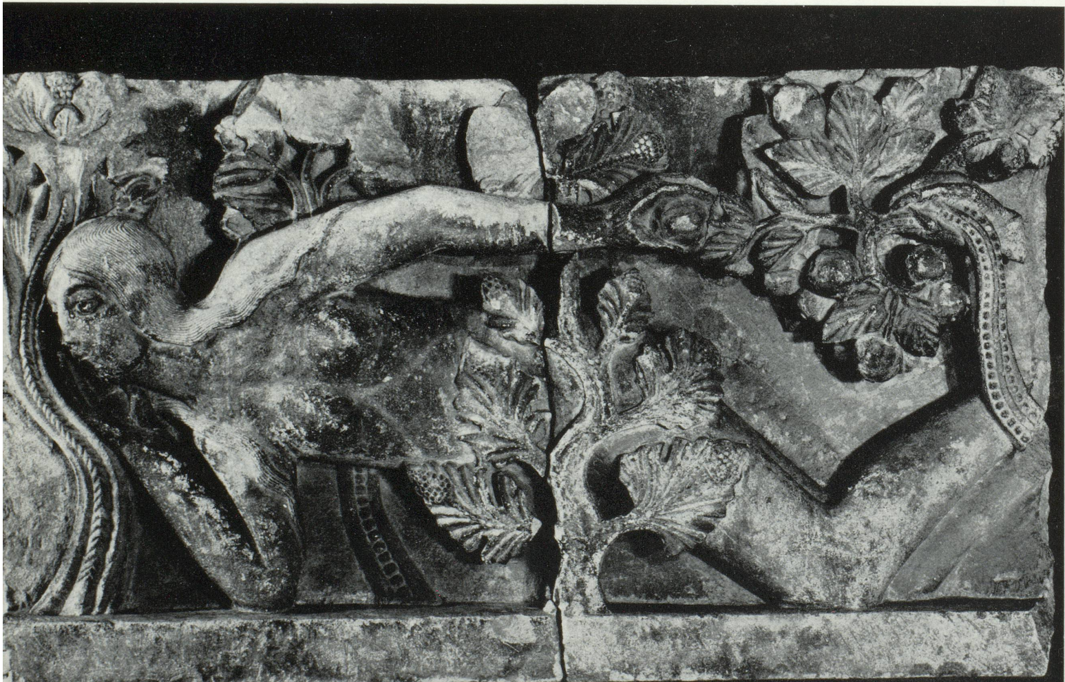
Autun : Ève (musée Rolin).