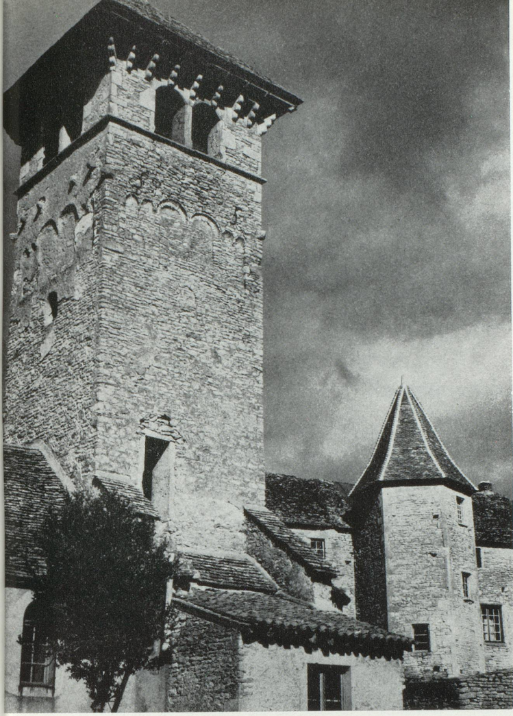
Blanot : l'Église et le Prieuré.