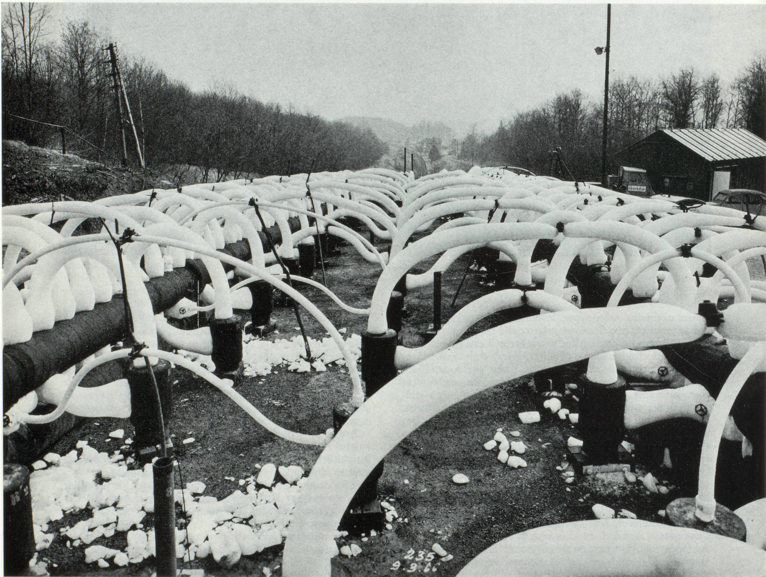
Congélation de la voûte du tunnel de Genevreuille — détail de la distribution du froid.

De nombreuses autres applications insolites et peu connues du froid industriel pourraient encore être évoquées; la liste en serait longue et incomplète. Aussi, je rappellerai brièvement qu'en agriculture, par exemple,