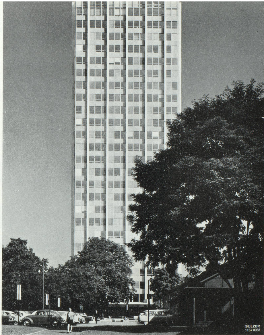
Sulzer. Bâtiment administratif climatisé.

préalable dans une centrale de climatisation et l'évacuation de l'air usé, c'est-à-dire qu'un flux constant d'air traverse le local. Afin d'éviter toute sensation de courants d'air désagréable, il faut que les mouvements d'air ne dépassent pas la vitesse de 0,1 à 0,2 m à la seconde dans bien des cas, s'il s'agit de personnes âgées ou exerçant une profession exigeant une grande sensibilité (horlogerie par exemple), il est recommandé de ne pas dépasser 0,15 m/s. Le moyen le plus sûr de répartir l'air climatisé de façon uniforme et à des vitesses imperceptibles est le plafond perforé.