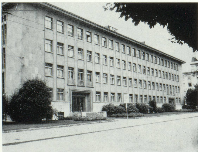
Siège de la Chambre suisse de l'horlogerie, La Chaux-de-Fonds.

Aucune activité économique autre que l'horlogerie ne pouvait mieux répondre aux conditions qui viennent