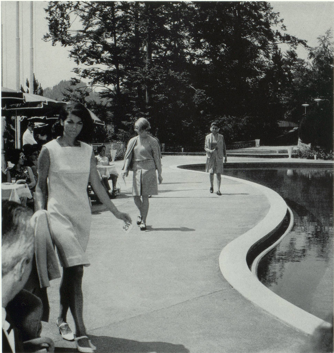
Robe et veste jersey laine tricoté bleu et blanc, dessin tweed. Modèle et jersey Hanro : Handschin et Ronus S.A. (Hanro), Liestal.