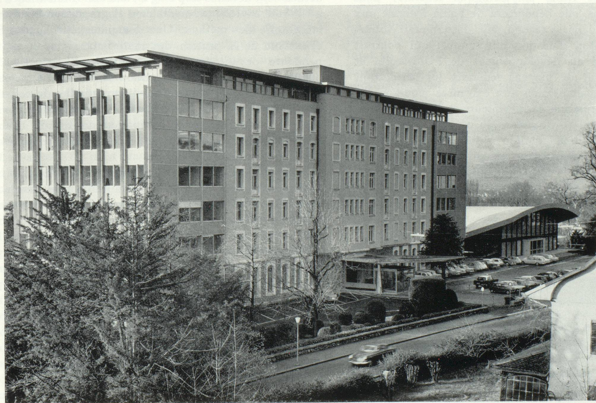
École polytechnique, bâtiment principal et bâtiment de l'Aula.

Directeur de l'École Polytechnique de l'Université de Lausanne