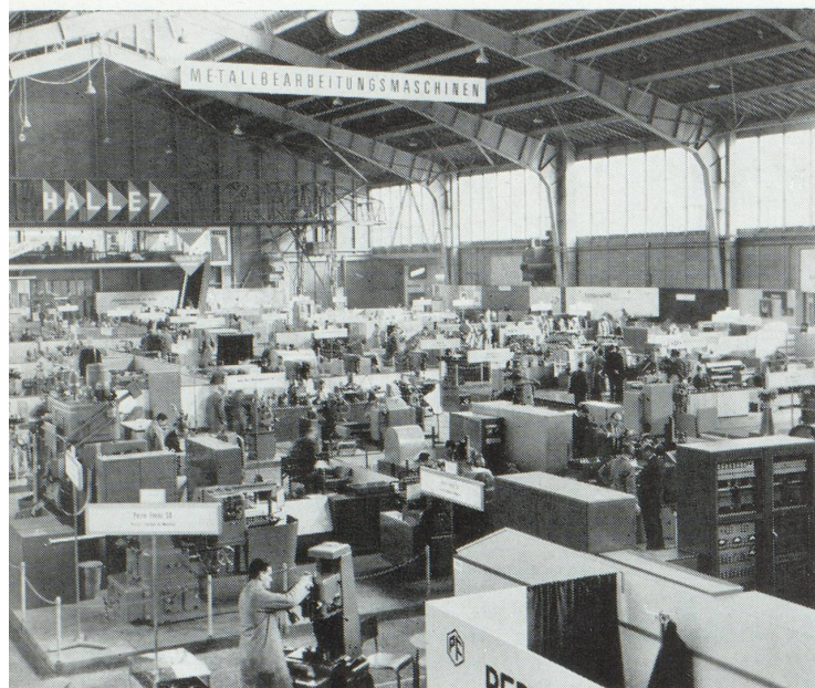
Deux grandes halles couvrant ensemble 10 000 m 2 de surface sont à la disposition des machines-outils à la Foire de Bâle.