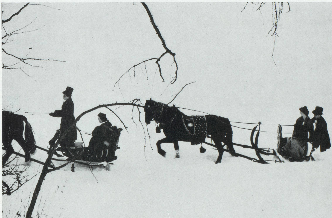
“ ... mille occasions de plaisirs tranquilles, tels que les charmantes parties de traîneaux qui filent sur la neige au son joyeux des clochettes...”

On skie à Maloja , à Silvaplana , à Pontresina et surtout à St. Moritz , dont le nom est connu du monde entier, dont les hôtels sont réputés et dont la vie mondaine égale — tant les vedettes et les célébrités abondent — celle des grandes capitales comme Paris et Londres. Voici encore Samedan , si ensoleillé, avec une place d'aviation, Zuoz à 1 717 mètres d'altitude et Zernez d'où l'on va visiter le Parc national suisse, établi en pleine nature,