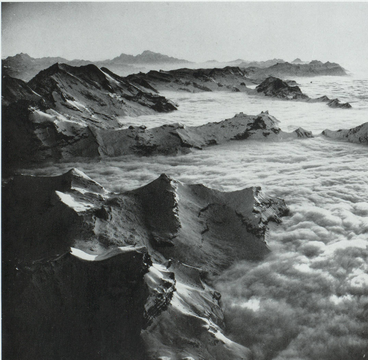
Morgenberghorn dans le brouillard (Oberland bernois).

Toutes ces stations ont une ou plusieurs écoles de ski comprenant de nombreuses classes où des professeurs expérimentés enseignent la dernière technique à des élèves sur « lattes » aussi joyeux qu'appliqués.