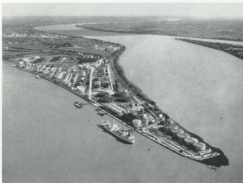
INSTALLATIONS PÉTROLIÈRES AU BEC D'AMBÈS. CONFLUENT DE LA GARONNE ET DE LA DORDOGNE

Corrélativement, les installations portuaires sont aménagées : rempiètement de quais à Bassens, construction de postes spécialisés à grands débits : céréales, bois ou pondéreux, construction de postes pour pétroliers au Verdon et à Ambès.