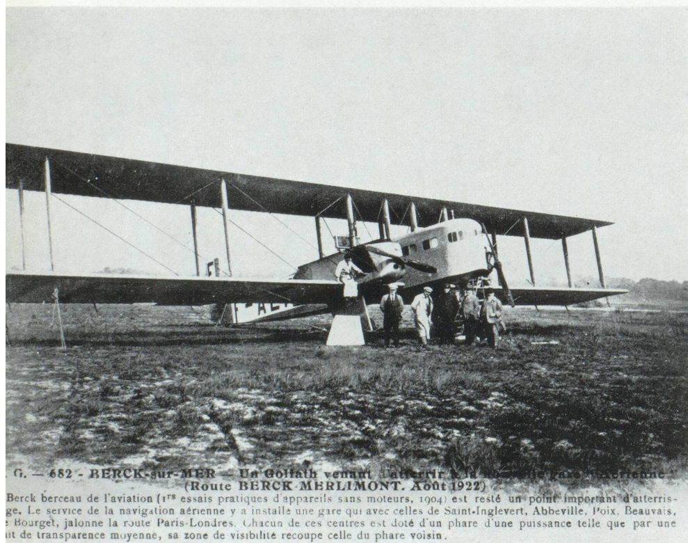
G. — 682 - BERCK-sur-MER — Un Goliath venant d'atterrir à la gare de Berck-sur-Mer (Route BERCK-MERLIMONT. Août 1922)

Les appareils qui assurent alors régulièrement et fièrement leur mission nous font aujourd'hui sourire. A côté de nos souples Caravelle, transportant jusqu'à 86 passagers à une moyenne de 850 km/heure et sur des étapes de 4.000 kilomètres, que peut bien représenter encore le Lioré et Olivier