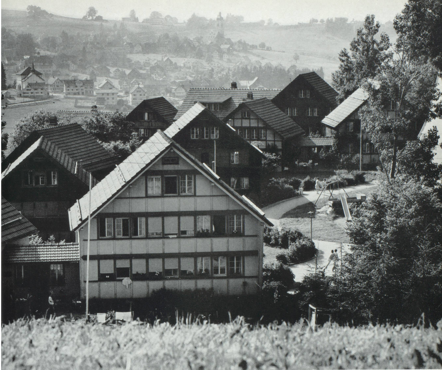
Le village Pestalozzi pour enfants étrangers à Trogen.