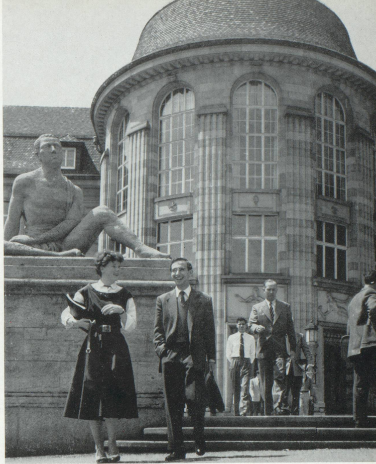
L'Université de Zurich.

systèmes d'éducation et des réformes de programmes destinés à être « officialisés » plus tard. C'est ainsi que le développement du sport à l'école est venu des instituts privés, comme aussi l'incorporation des travaux manuels aux plans d'études primaires et secondaires.