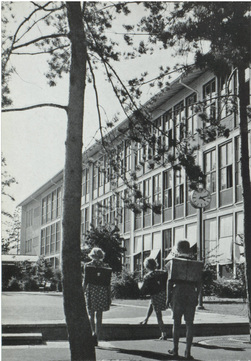
École primaire à Zurich.