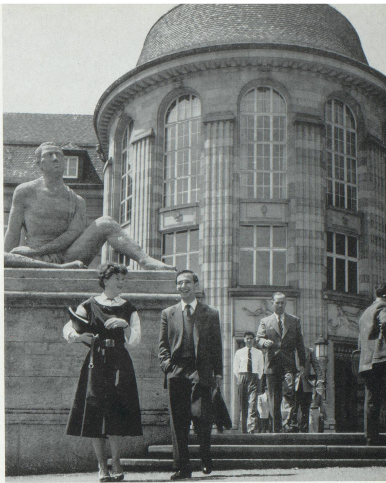
L'Université de Zurich.

systèmes d'éducation et des réformes de programmes destinés à être « officialisés » plus tard. C'est ainsi que le développement du sport à l'école est venu des instituts privés, comme aussi l'incorporation des travaux manuels aux plans d'études primaires et secondaires.