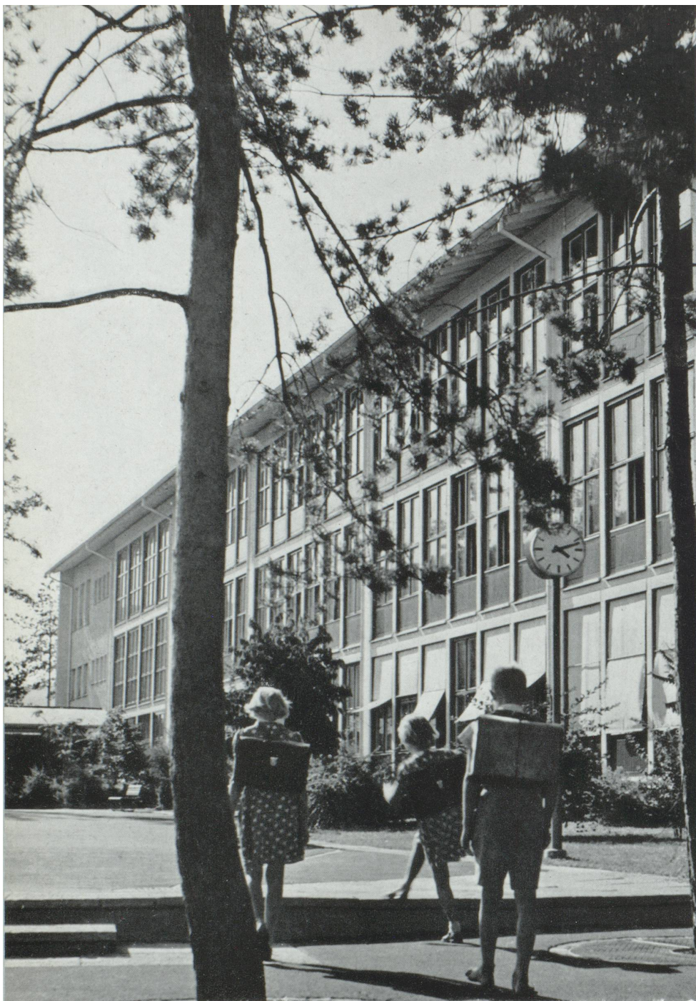
École primaire à Zurich.