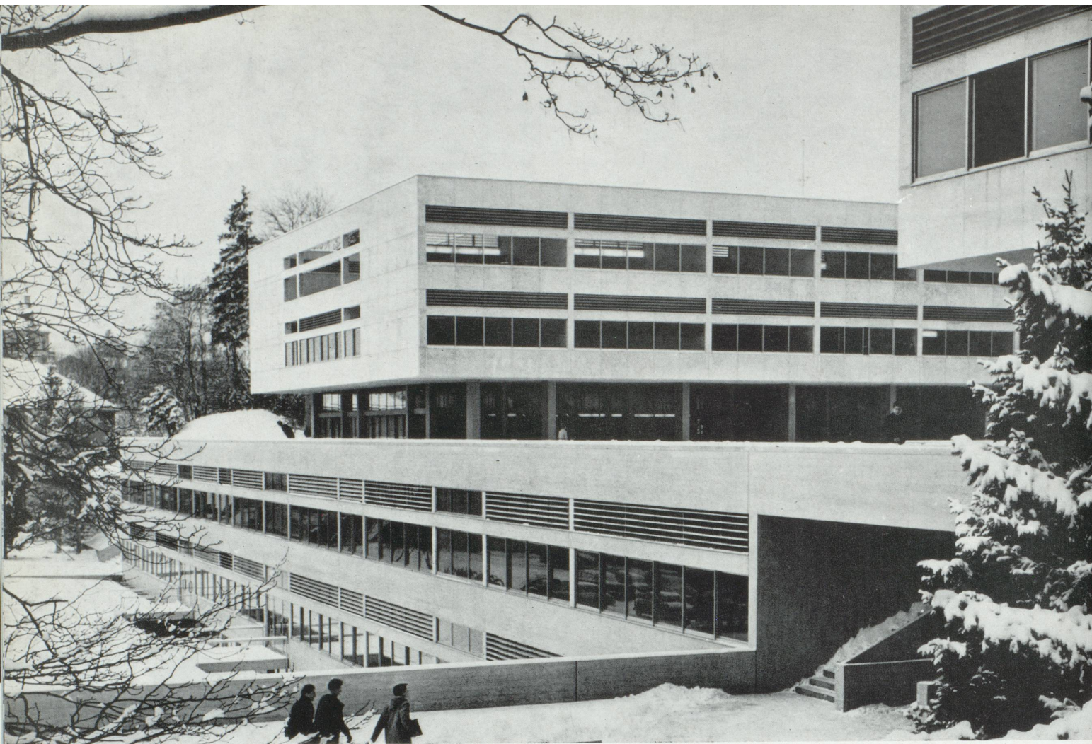
École en Suisse allemande.