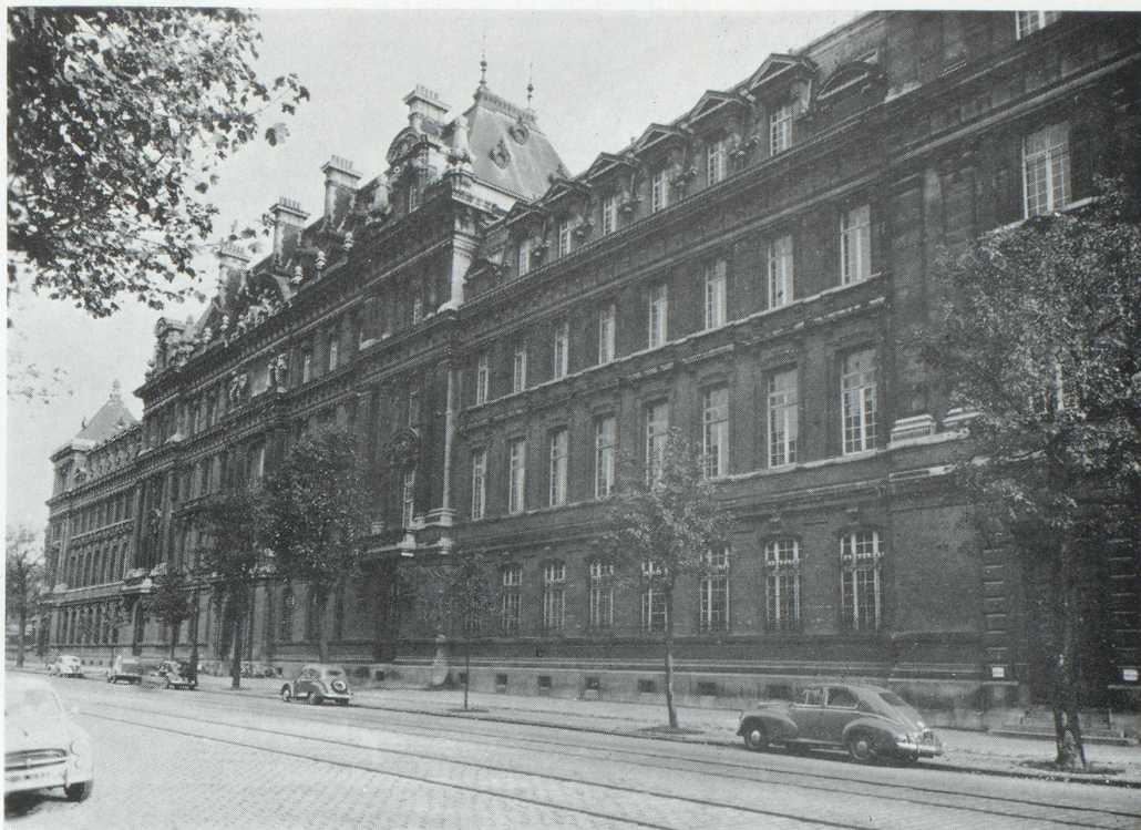
L'École nationale d'Ingénieurs Arts et Métiers de Colbert.

économique, on exprimait en même temps la requête d'un développement intellectuel correspondant : on demande une grande Université, parce qu'on en escompte sans doute un appui scientifique; on en attend aussi une aide pour l'éducation et, en particulier, l'éducation supérieure des enfants. On pense surtout qu'elle fournira un cadre intellectuel et moral. La vie d'une province n'est pas concevable sans un esprit qui lui soit propre, sans une âme de la province. L'Université est l'organisme dans lequel cette âme s'incarne et par lequel elle s'exprime. »