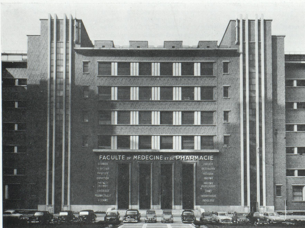
La Faculté de Médecine et de Pharmacie de Lille.