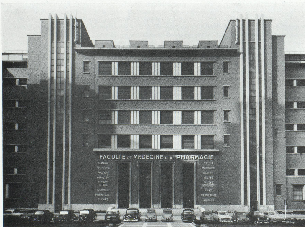
La Faculté de Médecine et de Pharmacie de Lille.