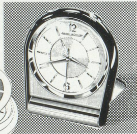
Réf. 3157 Modèle Memovox Mignonnette. Pour Madame, cadeau charmant d'une conception essentiellement pratique.