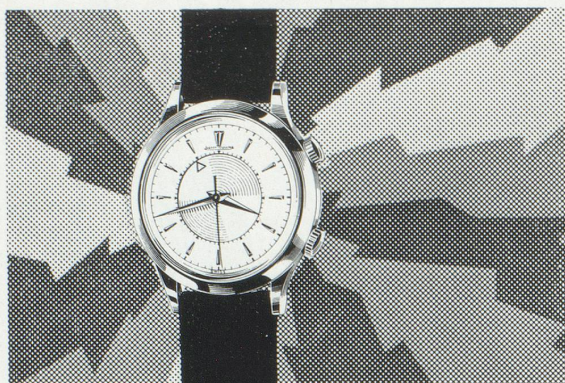
Réf. E 852 étanche