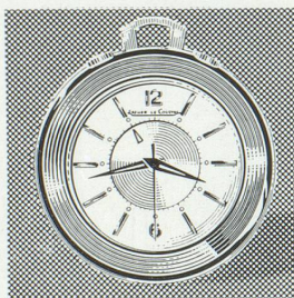
Réf. 3158 Memovox « Pocket ». Modèle s'adressant aussi bien à la femme - pour le sac - qu'à l'homme, comme montre de poche ou comme pendulette miniature sur le bureau.