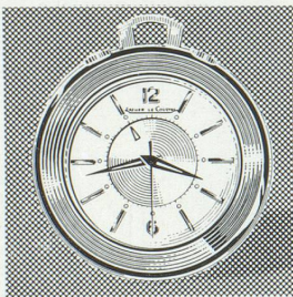
Réf. 3158 Memovox « Pocket ». Modèle s'adressant aussi bien à la femme - pour le sac - qu'à l'homme, comme montre de poche ou comme pendulette miniature sur le bureau.