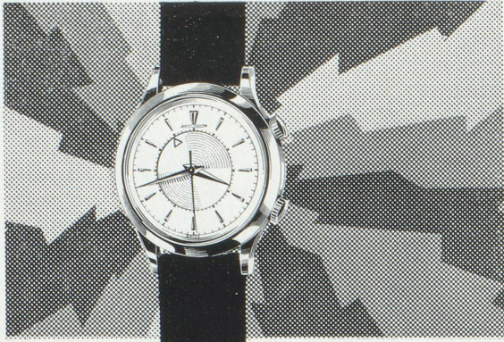
Réf. E 852 étanche