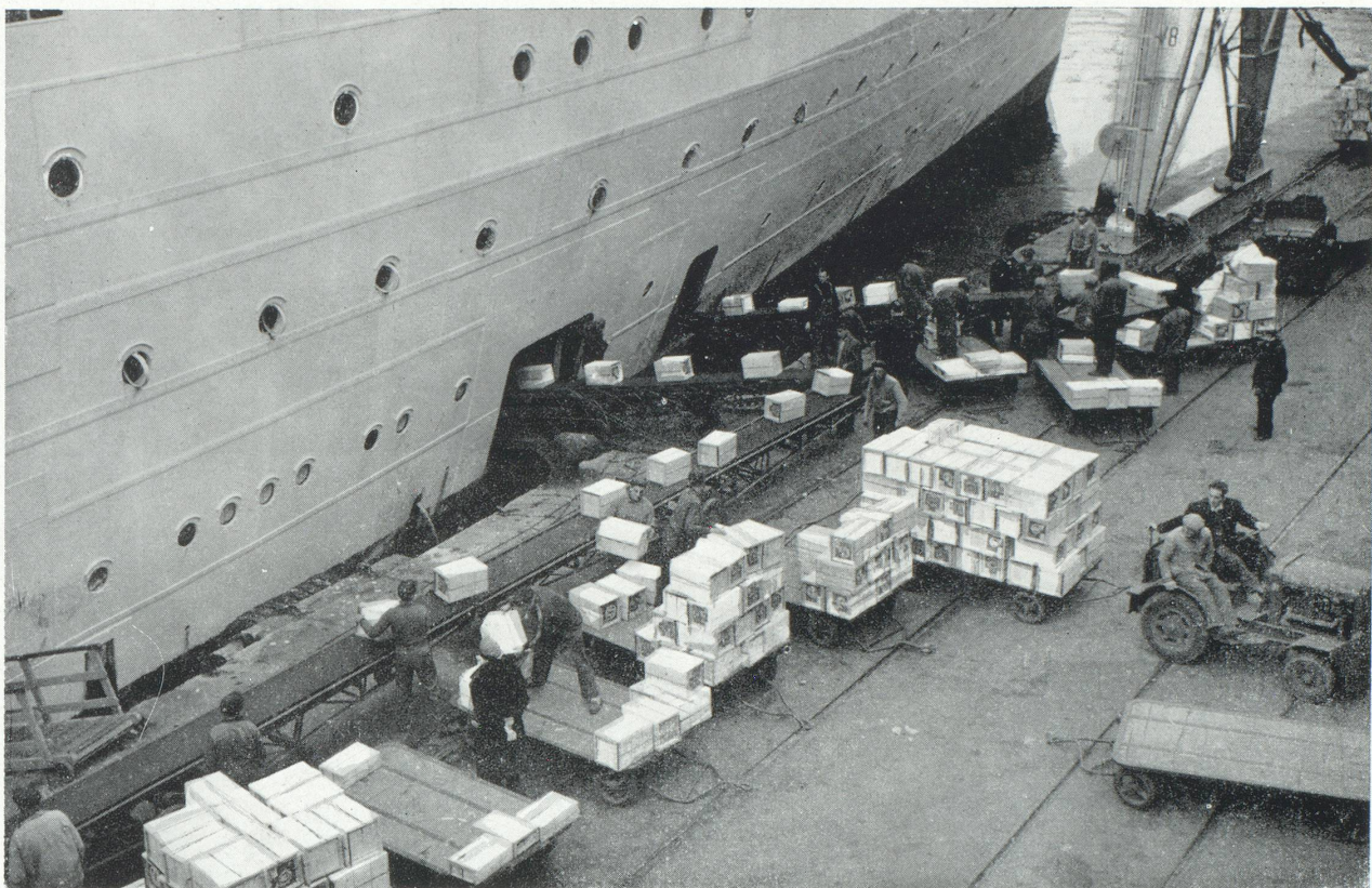
Manutention de caisses de primeurs par bandes transporteuses.