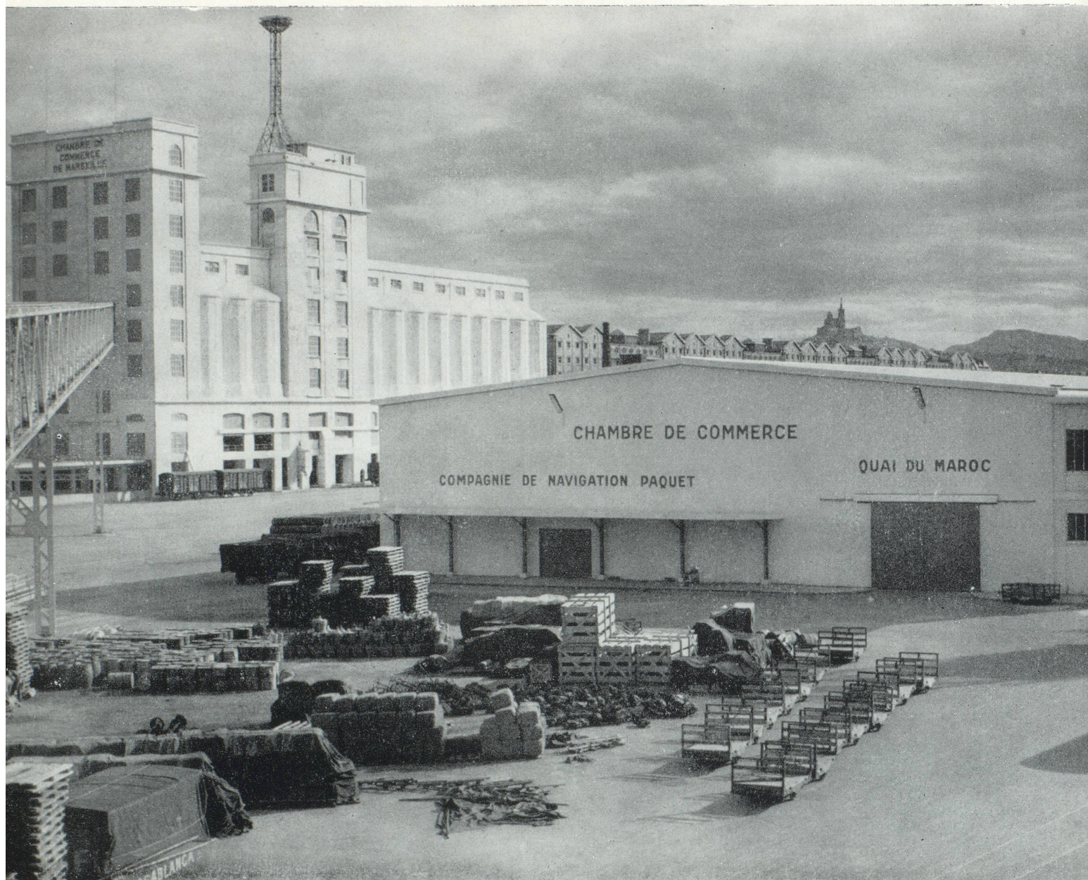
Les entrepôts de la Chambre de Commerce de Marseille

nière très sensible : avec 7.261 tonnes le chiffre des agrumes se trouve pratiquement doublé par rapport à l'année précédente, celui des fruits passant de 2.984 tonnes à 3.910 tonnes.