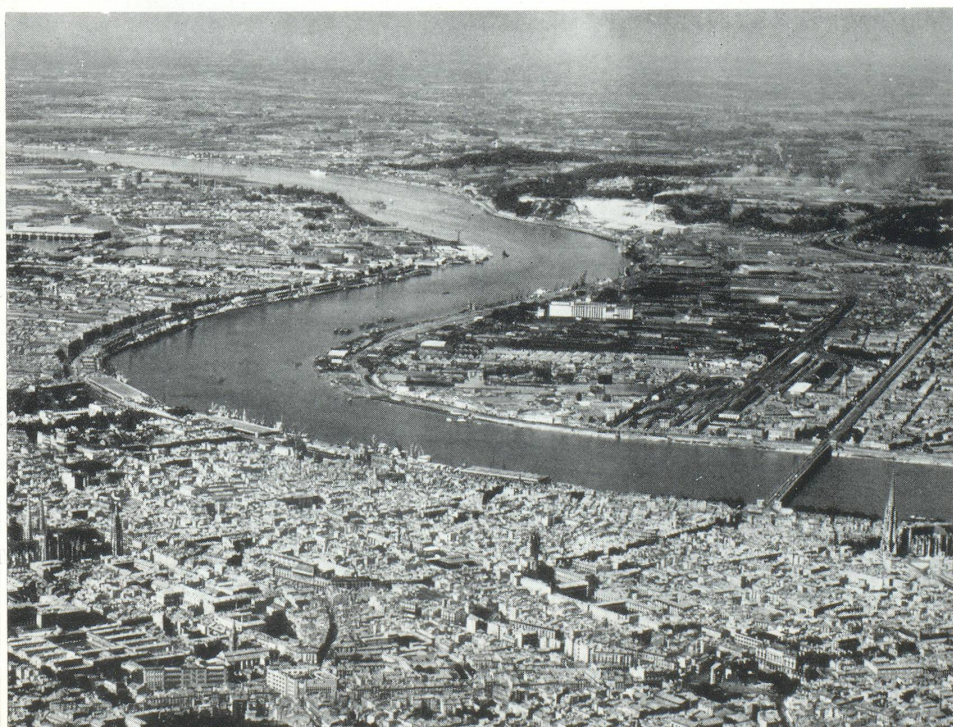
Vue aérienne du Port de Bordeaux prise vers l'aval

Pour coordonner l'action de tous ceux qui, économiquement et socialement, sont intéressés au rayonnement économique de notre région, un organisme nouveau dénommé « Centre d'Expan-