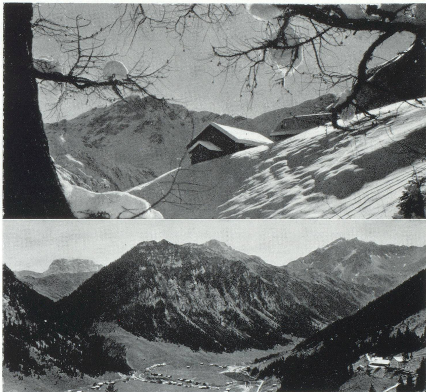
En haut : Paysage d'hiver près de Silum, 1.500 mètres En bas : Vue de Kulm dans la vallée de Samina avec le Hahnen Spiel

L'approvisionnement du pays en courant électrique industriel et ménager est assuré par les centrales du Liech-