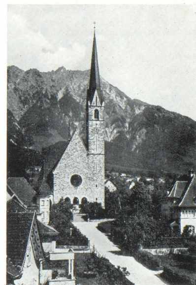
Schaan et son église

Le Liechtenstein est une Monarchie héréditaire et constitutionnelle, État démocratique à régime parlementaire. Le pouvoir appartient au Prince et au peuple et est exercé par les deux, selon la Constitution du 5 octobre 1921. La représentation de l'État vis-à-vis des puissances étrangères revient au Prince. La nomination des fonctionnaires de l'État, le droit de grâce et d'abolition font partie des privilèges princiers. La Diète se compose de 15 députés, élus pour 4 ans d'après le système de la représentation proportionnelle, par vote secret et direct; sa convocation, sa clôture, sa dissolution et son report sont du ressort du Prince. La convocation de la Diète et sa dissolution peuvent être demandées par 600, respectivement 900 électeurs, ou 3, respectivement 4 communes. En cas de dissolution de la Diète, de nouvelles élections doivent avoir lieu dans les 6 semaines. Le peuple et les communes peuvent lancer un referendum contre des lois et contester certaines décisions financières de la Diète. Le droit d'initiative légale est également fixé par la Constitution. Le droit législatif et le droit de contrôle sur l'ensemble de l'administration du pays reviennent à la Diète. D'autres droits importants, inscrits dans la Constitution, font également partie de ses attributions.