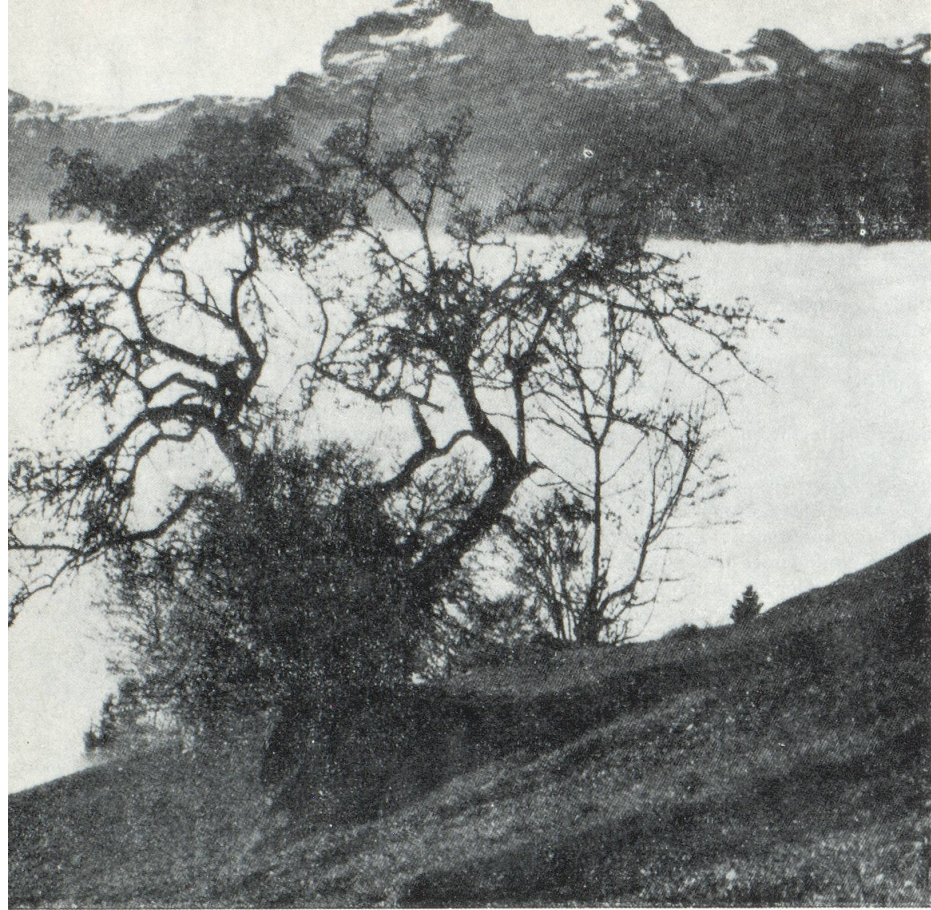
Mer de brouillard sur le Liechtenstein

Le Gouvernement est constitué par un Chef et deux Conseillers et un nombre égal de Représentants. Le Chef du Gouvernement et son adjoint sont nommés pour 6 ans par le Prince, sur proposition de la Diète. Les Conseillers et leurs Représentants sont élus par la Diète pour la durée de celle-ci. Leur élection doit être confirmée par le Prince. Il existe, à Vaduz, une instance administrative de recours contre les décisions du Gouvernement. Ce Sénat de 5 membres est élu par la Diète, pour la même durée que celle-ci, à condition que son Président et son Vice-Président soient nommés par le Prince, sur proposition de la Diète. A Vaduz se trouve un Tribunal d'État pour la protection des droits constitutionnels, pour les conflits entre tribunaux et les autorités administratives, et comme Tribunal disciplinaire pour les membres du Gouvernement. Il se compose d'un Président et de quatre Juges, choisis par la Diète. Le choix du Président doit être soumis à l'approbation du Prince et son mandat est de 5 ans. Les membres du Tribunal d'État sont inamovibles.