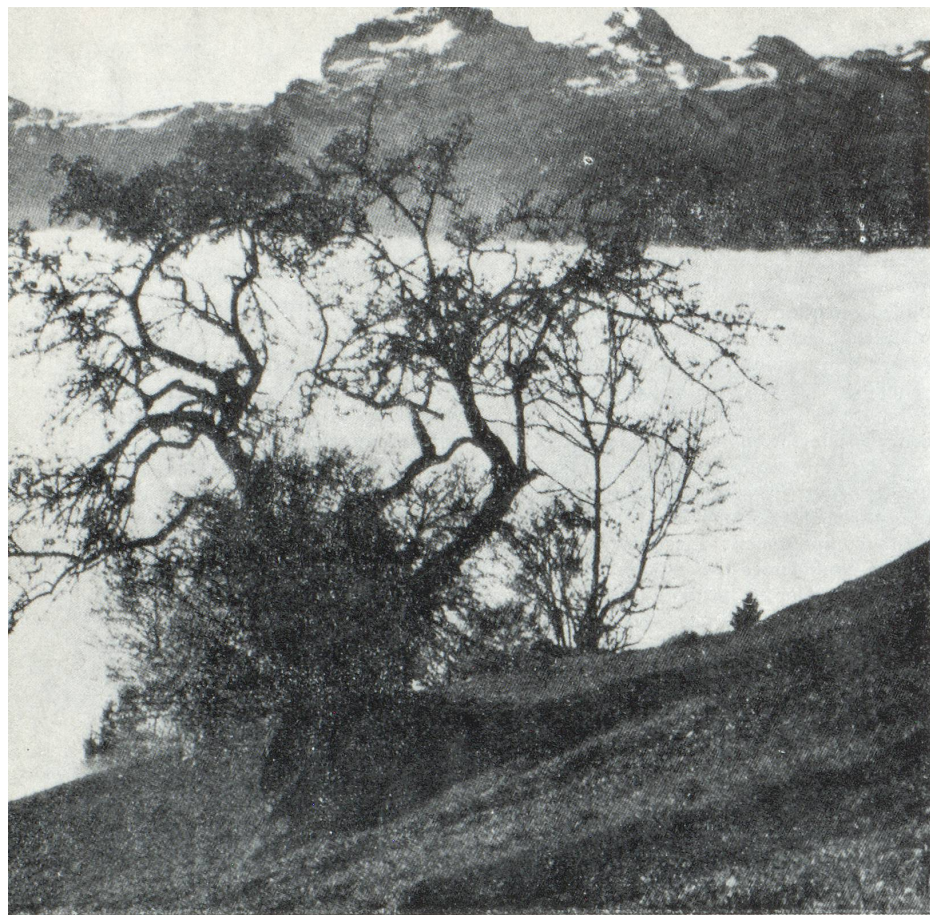
Mer de brouillard sur le Liechtenstein

Le Gouvernement est constitué par un Chef et deux Conseillers et un nombre égal de Représentants. Le Chef du Gouvernement et son adjoint sont nommés pour 6 ans par le Prince, sur proposition de la Diète. Les Conseillers et leurs Représentants sont élus par la Diète pour la durée de celle-ci. Leur élection doit être confirmée par le Prince. Il existe, à Vaduz, une instance administrative de recours contre les décisions du Gouvernement. Ce Sénat de 5 membres est élu par la Diète, pour la même durée que celle-ci, à condition que son Président et son Vice-Président soient nommés par le Prince, sur proposition de la Diète. A Vaduz se trouve un Tribunal d'État pour la protection des droits constitutionnels, pour les conflits entre tribunaux et les autorités administratives, et comme Tribunal disciplinaire pour les membres du Gouvernement. Il se compose d'un Président et de quatre Juges, choisis par la Diète. Le choix du Président doit être soumis à l'approbation du Prince et son mandat est de 5 ans. Les membres du Tribunal d'État sont inamovibles.