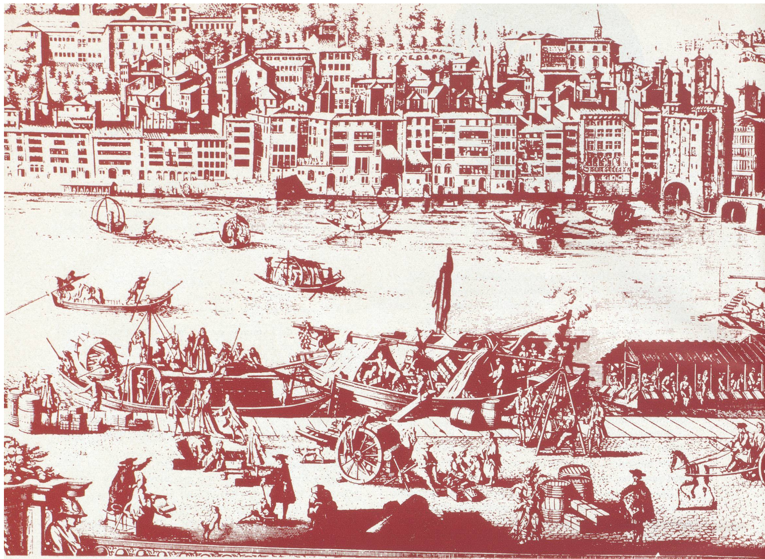
Le port St-Antoine en 1720

Si les hommes de finance ont toujours eu à Lyon du caractère au sens le plus noble du mot, le quartier des banques lui-même n'en manque pas. La rue de la République — ex-rue Impériale — qui vient de fêter brillamment son centenaire, aurait pu s'appeler « rue des Banques ». Les principaux établissements bancaires y sont installés et la plupart d'entre eux vivent le jour dans le quartier.