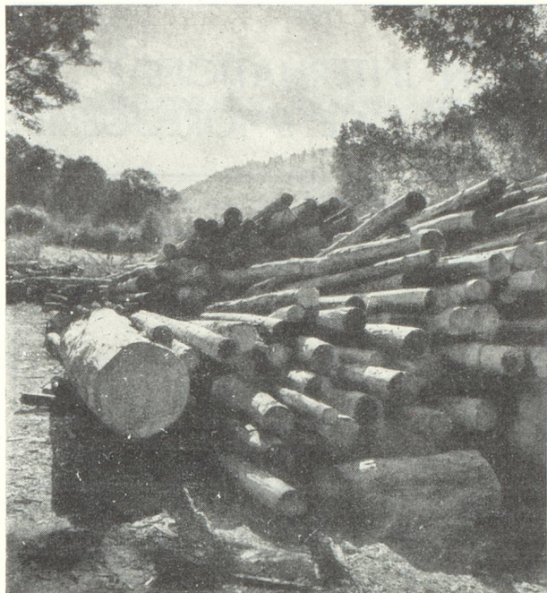
Coupe de sapins.