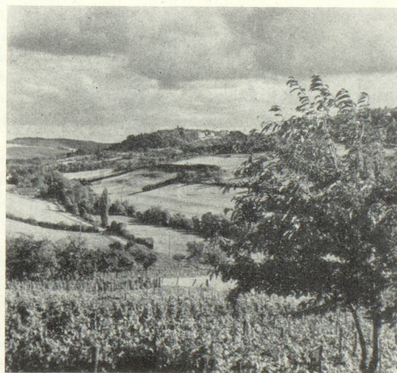
Le site de Flavigny.

Dijon est aussi capitale gastronomique, c'est la porte de la région des grands vignobles de Bourgogne; Gevrey-Chambertin, château du Clos-Vougeot (siège de la fameuse confrérie des Chevaliers du Tastevin), Nuits-Saint-Georges et Beaune.