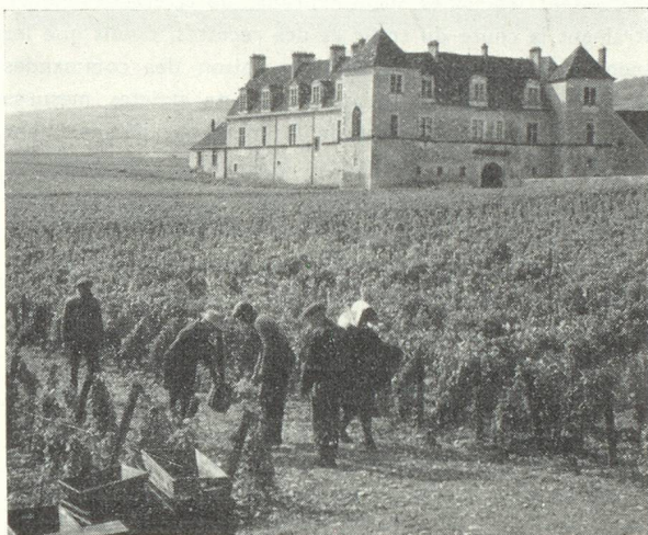
Le château du Clos-Vougeot.

Lente ou rapide, selon les goûts ou l'humeur du touriste, cette route blanche qui traverse le cœur de la Bourgogne est une des plus attachantes et une des plus évocatrices de la vieille Europe.