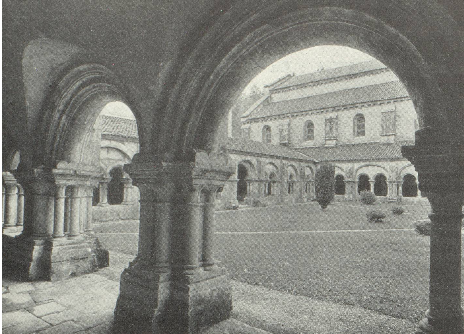
Le cloître de l'Abbaye de Fontenay.