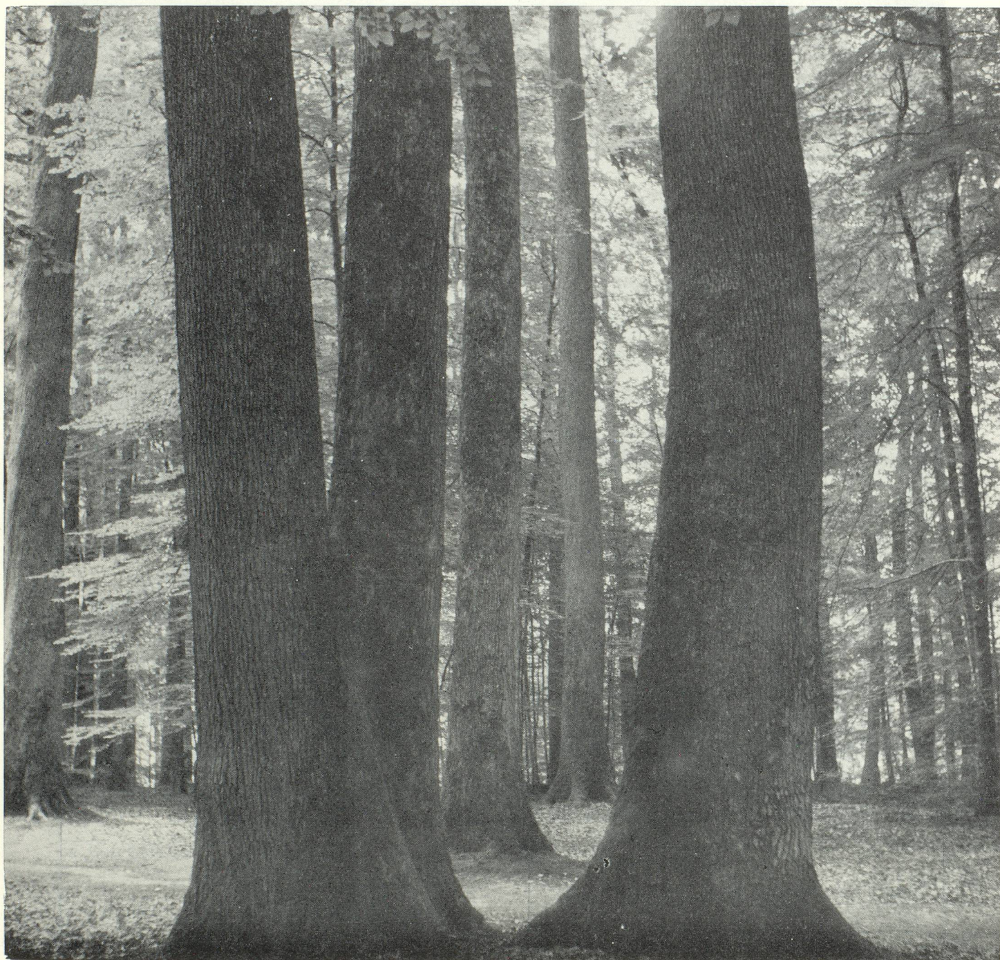
La forêt de Bergé.