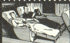
★ dans d'excellents fauteuils-couchettes.