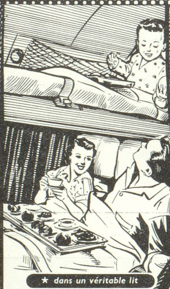
★ dans un véritable lit

3, BOULEVARD MALESHERBES - PARIS - TÉL. ANJOU 08-00