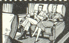
★ dans les fauteuils inclinables Air France.