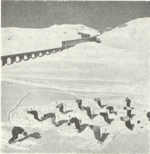
Une petite demi-heure de gymnastique en plein air...