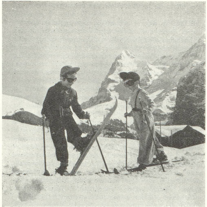
Le ski se pratique à tout âge...

L UNDI. — Sitôt crevé le rideau de brouillard qui couvre la plaine, la haute vallée apparaît, étincelante sous la neige et le soleil. Pas un nuage. Chaleur dans les cœurs. Chaleur dans les chambres confortables de l'hôtel où les trente participants sont bientôt casés.