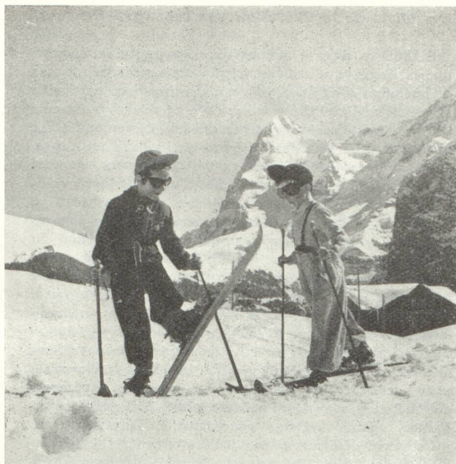
Le ski se pratique à tout âge...

L UNDI. — Sitôt crevé le rideau de brouillard qui couvre la plaine, la haute vallée apparaît, étincelante sous la neige et le soleil. Pas un nuage. Chaleur dans les cœurs. Chaleur dans les chambres confortables de l'hôtel où les trente participants sont bientôt casés.