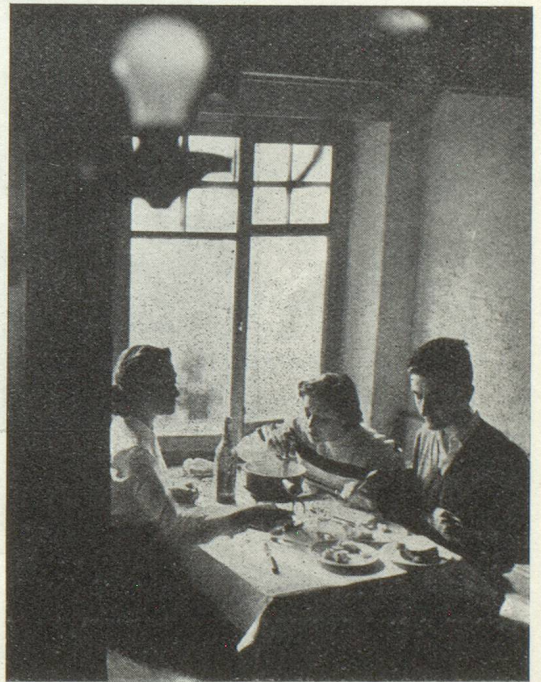
Une « fondue » vivement appréciée après une journée de sport