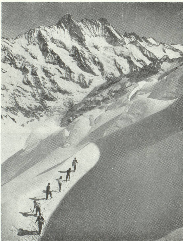
La Nursery et les « as » partent en commun pour une course...