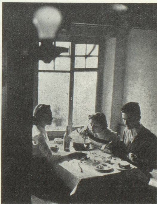
Une « fondue » vivement appréciée après une journée de sport