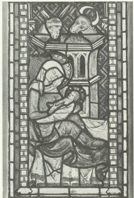
Un des célèbres vitraux de Koenigsfelden près de Brougg

De nombreux observatoires panoramiques procurent une vue d'ensemble de cette région bénie, mais les