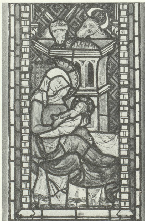
Un des célèbres vitraux de Koenigsfelden près de Brougg

De nombreux observatoires panoramiques procurent une vue d'ensemble de cette région bénie, mais les