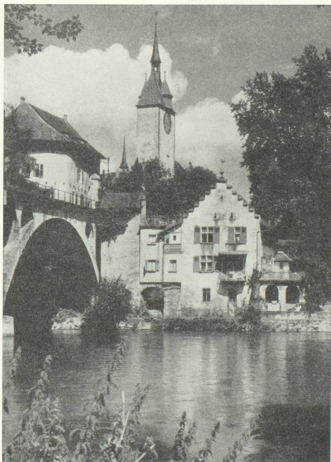
La jolie petite cité de Bremgarten

Une vie active anime cependant la grande cité bâloise de part et d'autre du Rhin, ainsi que nombre de petites villes et bourgades amènes dans leur physionomie comme dans leurs coutumes : Aarau, Baden, Bremgarten, Brougg, Laufon, Laufenbourg, Lenzbourg,