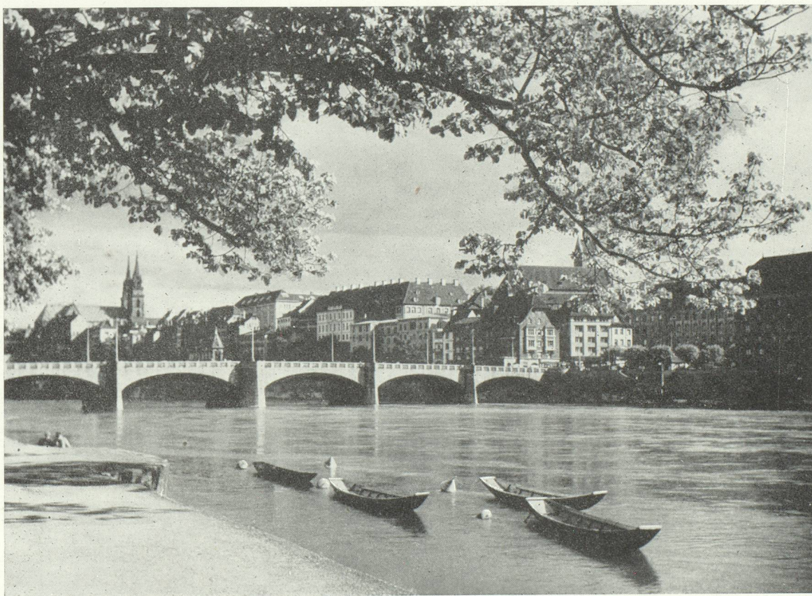
Une vue classique de Bâle, avec le pont moyen sur le Rhin

Répétons-le : quiconque est curieux de dépaysement et aspire à connaître une intéressante région de la Suisse, ce paradis des vacances, à proximité immédiate de la France, peut se satisfaire pleinement par un séjour en Suisse nord-occidentale.