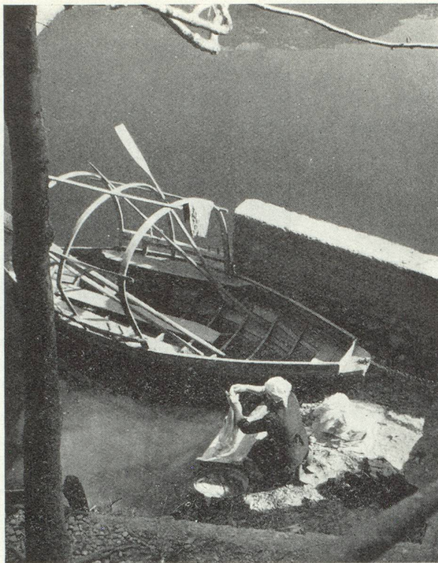
Sur les bords du lac Majeur