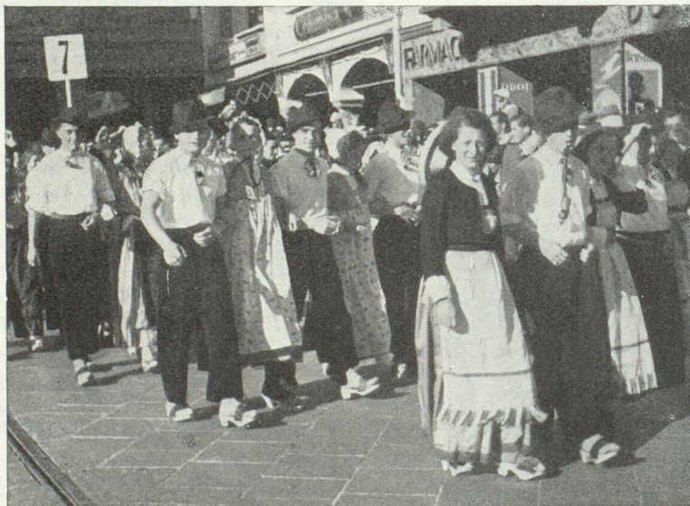
Lugano en fête