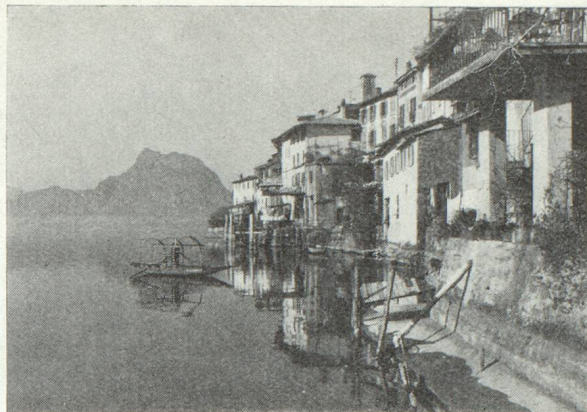
Gandria au bord du lac de Lugano

Par le rail ou la route : Interlaken , train ou 56 km. (via Thoun), Berne (changer), train ou 32 km., Bienne (changer), train ou 32 km., Moutier , train ou 12 km.,