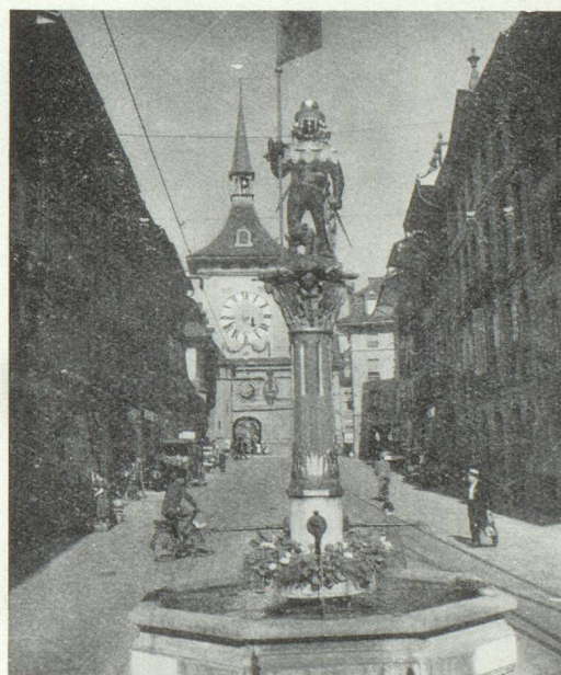
Une des célèbres fontaines de Berne