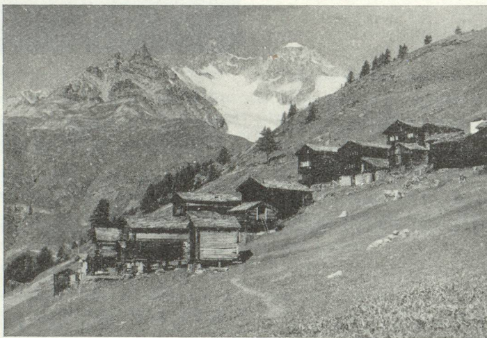
Findelen sur Zermatt, dans le canton du Valais

Nombreux funiculaires, téléphériques et télésièges.