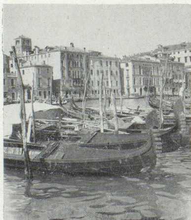
Ces gondoles vous conduiront à travers Venise.

Songez cependant aux pays merveilleux qui sont à votre portée.