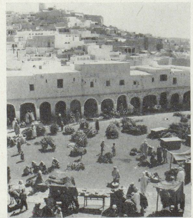
Découvrez le pittoresque de l'Afrique du Nord.

miné votre budget de vacances, renseignez-vous. Sans dépenser un sou de plus, vous pouvez passer des vacances inoubliables en découvrant des horizons nouveaux. Dites-vous maintenant : "Je pars en vacances par AIR FRANCE".