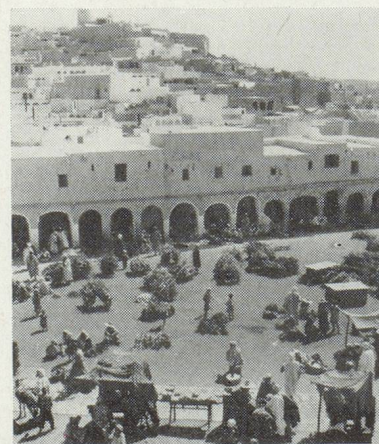
Découvrez le pittoresque de l'Afrique du Nord.

miné votre budget de vacances, renseignez-vous. Sans dépenser un sou de plus, vous pouvez passer des vacances inoubliables en découvrant des horizons nouveaux. Dites-vous maintenant : "Je pars en vacances par AIR FRANCE".