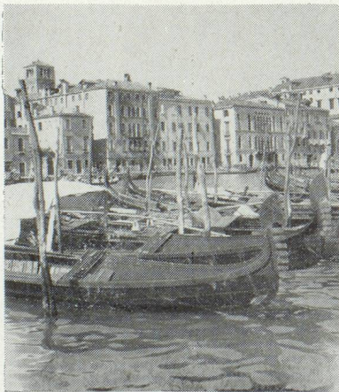
Ces gondoles vous conduiront à travers Venise.

Songez cependant aux pays merveilleux qui sont à votre portée.