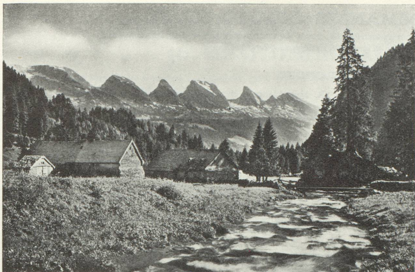
Les alpes du Toggenbourg