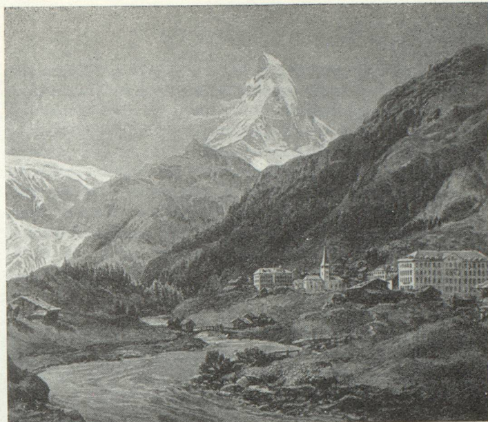
Zermatt et le Cervin

Conseiller d'État du canton de Vaud Vice-président de l'Office central suisse du tourisme