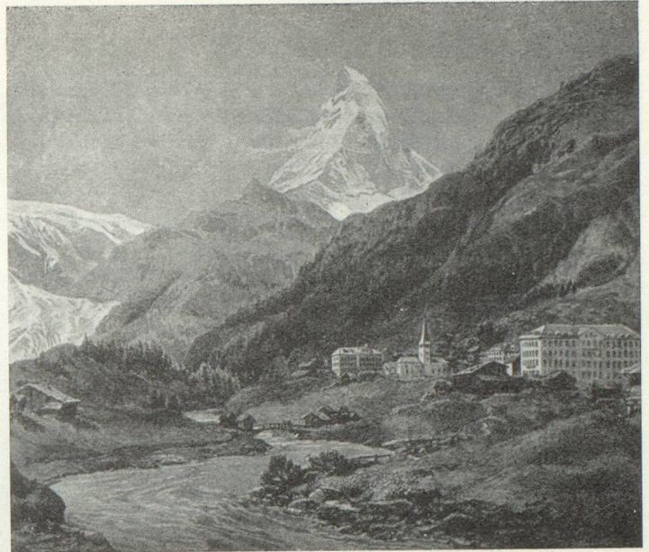
Zermatt et le Cervin

Conseiller d'État du canton de Vaud Vice-président de l'Office central suisse du tourisme