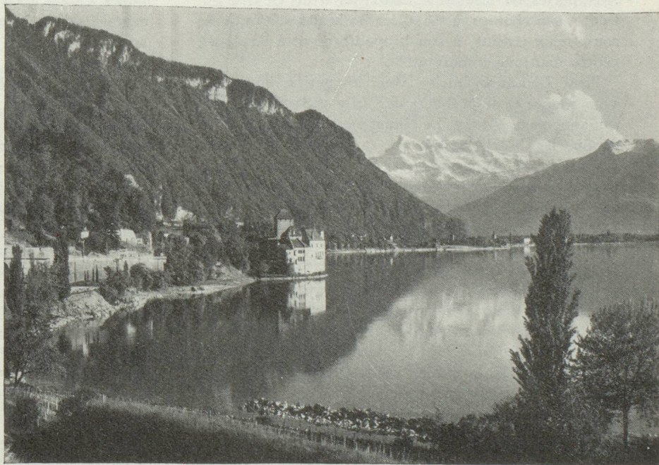
Le château de Chillon