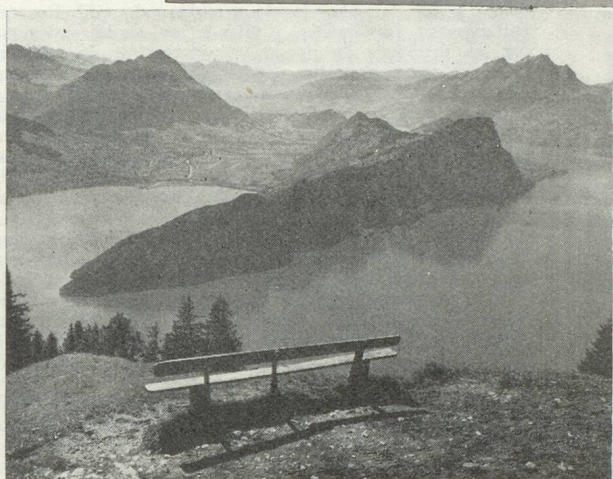
Le lac des Quatre-Cantons