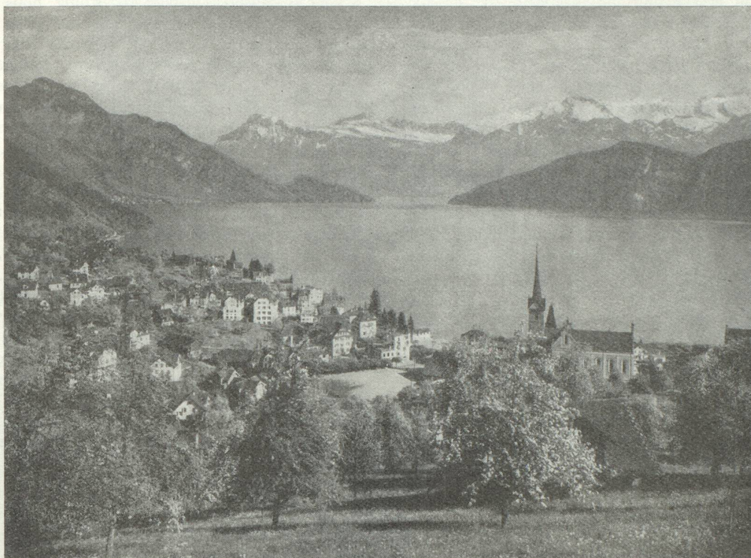
Weggis, au bord du lac des Quatre-Cantons