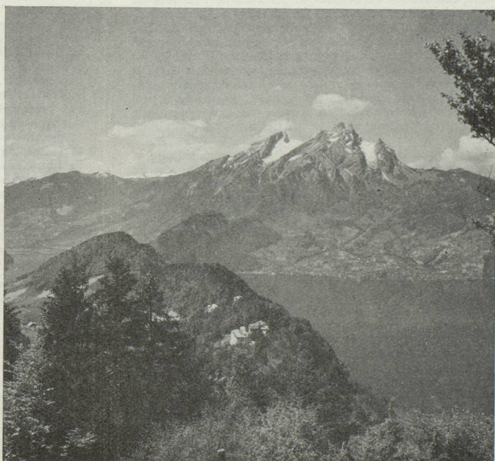
« C'est au cœur des montagnes qu'est née la Confédération suisse... »