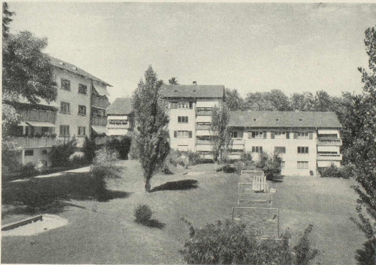
Maisons à appartements bon marché pour ouvriers et employés