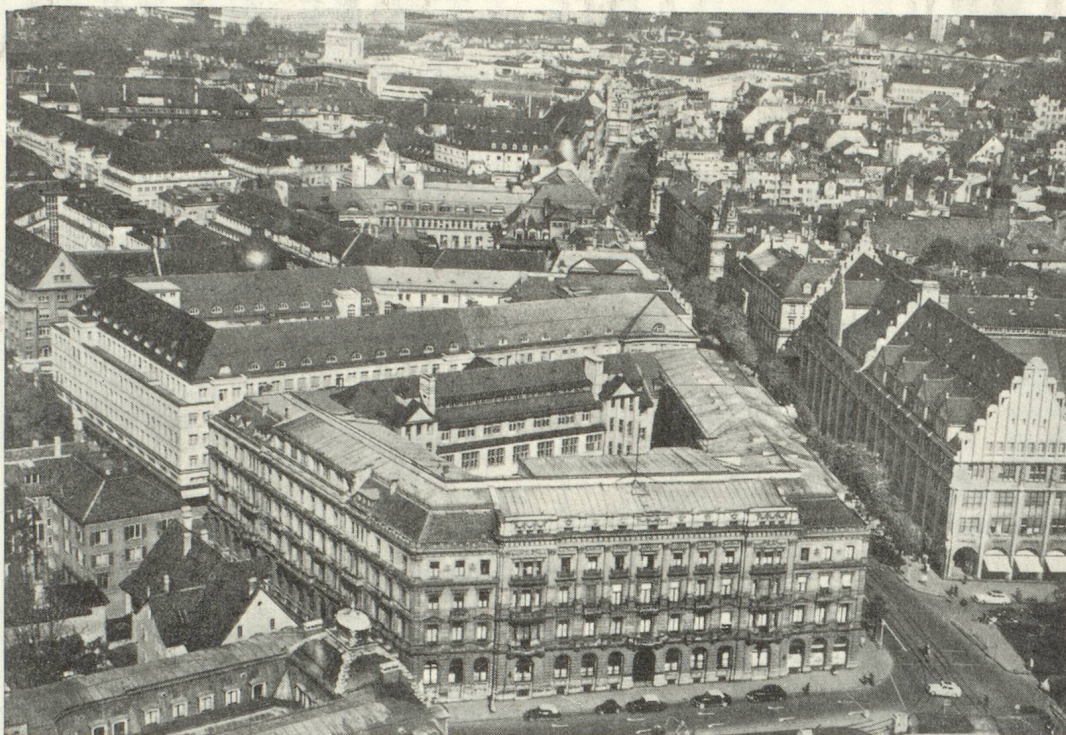
Centre des affaires de Zurich avec siège social du Crédit Suisse