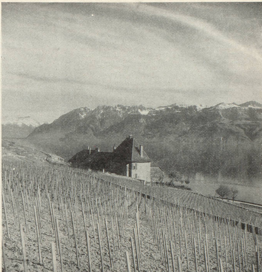
Lutry : lac Léman