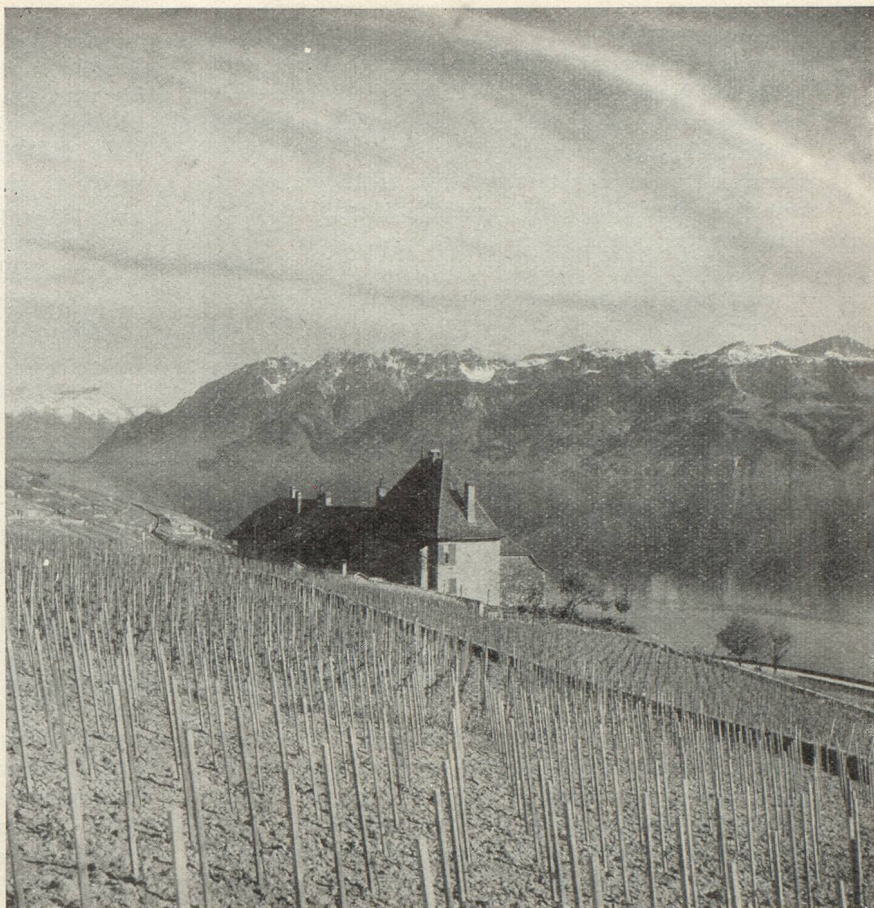
Lutry : lac Léman

IL est commun de dire que la Suisse est comme une petite Europe, ou plutôt comme une Europe en petit. Et c'est parce qu'elle est composée de quelque vingt-cinq Etats ayant chacun son gouvernement, qu'on y parle quatre langues dites nationales ce qui n'est qu'approximativement vrai, car trois au moins de ces langues portent le nom des peuples qui entourent la Suisse, le Français (à tout seigneur, tout honneur), l'Allemand et l'Italien, chez qui elles sont proprement nationales, comme seul peut l'être chez nous le romanche parlé par quelques dizaines de milliers de montagnards des Grisons — et que les confessions et dénominations chrétiennes les plus diverses y ont droit de cité. C'est ce qui a permis de dire à Gonzague de Reynold que la Suisse était diverse dans son unité. Ce qui est incontestablement une richesse pour un peuple fort.