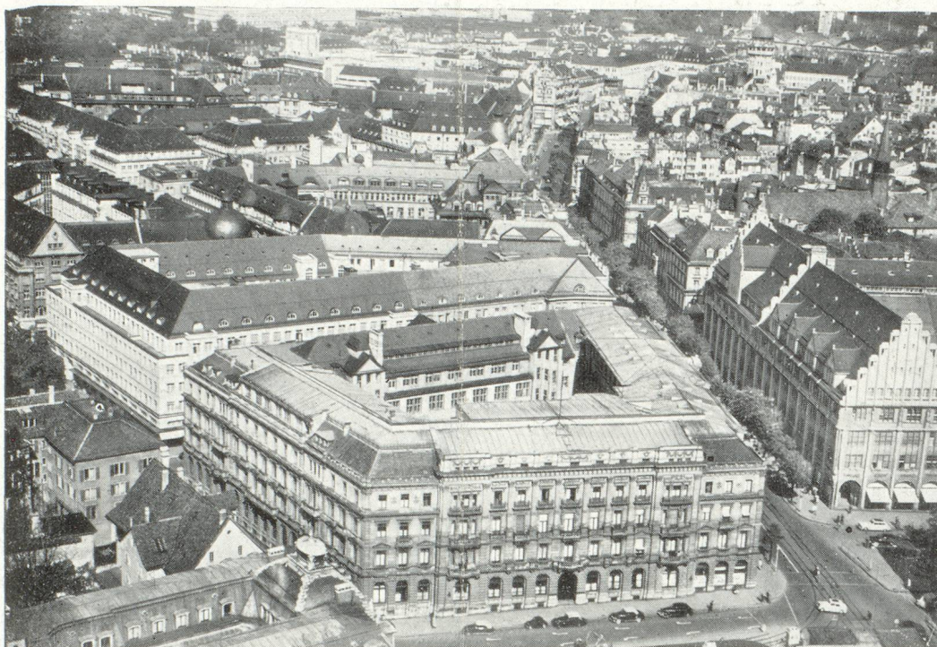
Centre des affaires de Zurich avec siège social du Crédit Suisse