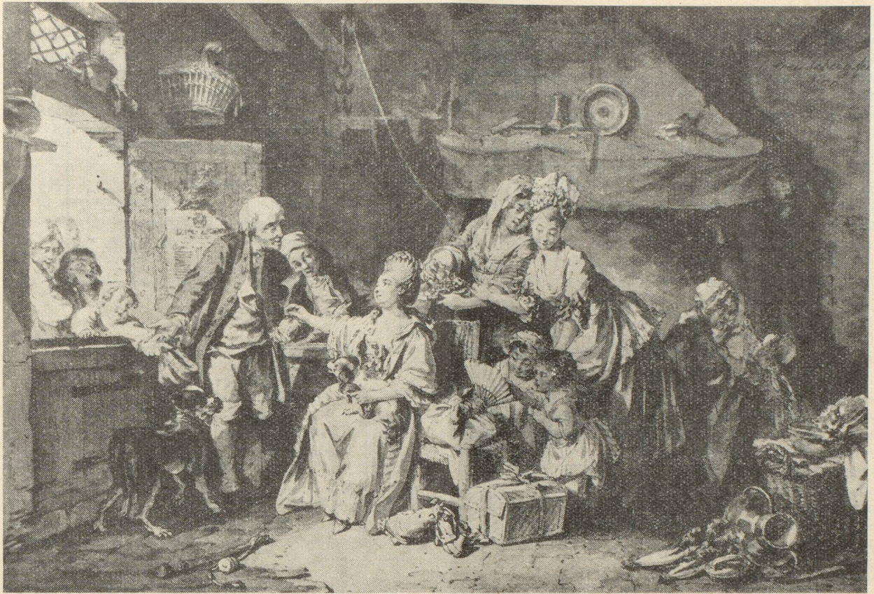
S. Freudenberger : La halle

Cependant, dans d'autres pièces, voici l'action. Il est sous-entendu que le rude labeur du paysan est la condition de son bonheur, mais c'est le bonheur qu'on nous dit. On ne représente pas l'homme au travail, labourant, fauchant ou abattant un arbre. Tout au plus le voyons-nous traire une vache, aiguïser sa faux ou apporter de l'alpe un fromage. Et quand l'image prend de l'importance, c'est aux délassements qu'on demande des sujets : un repas champêtre, une fête, un jeu. Lory-le-fils illustre celui du Lanceur de pierre et la Lutte des bergers , ou bien c'est une scène plus intime, une joie de famille, le Mariage , le Baptême , de König.