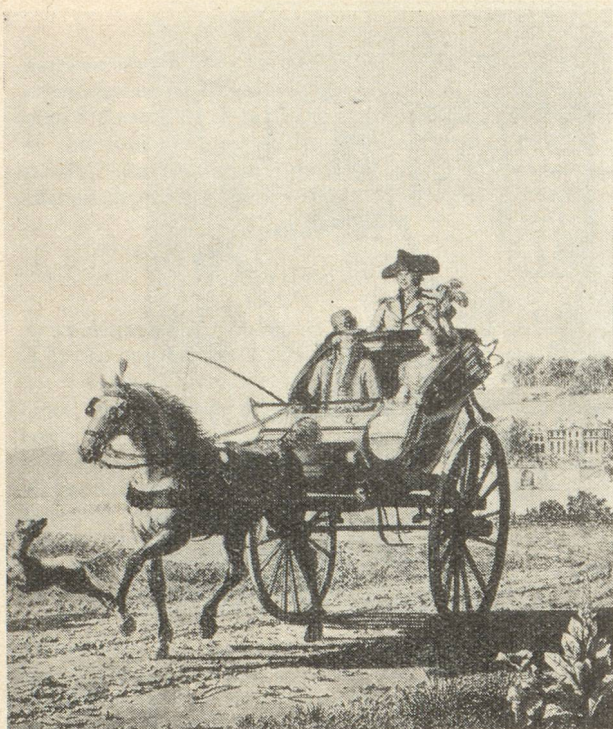
J.-J. Biedermann (1763-1830) : La promenade en « Wisky » (vers 1789)

ou les châteaux, mènent une vie compliquée, s'adonnent aux futilités et glissent quelquefois jusqu'à la corruption.