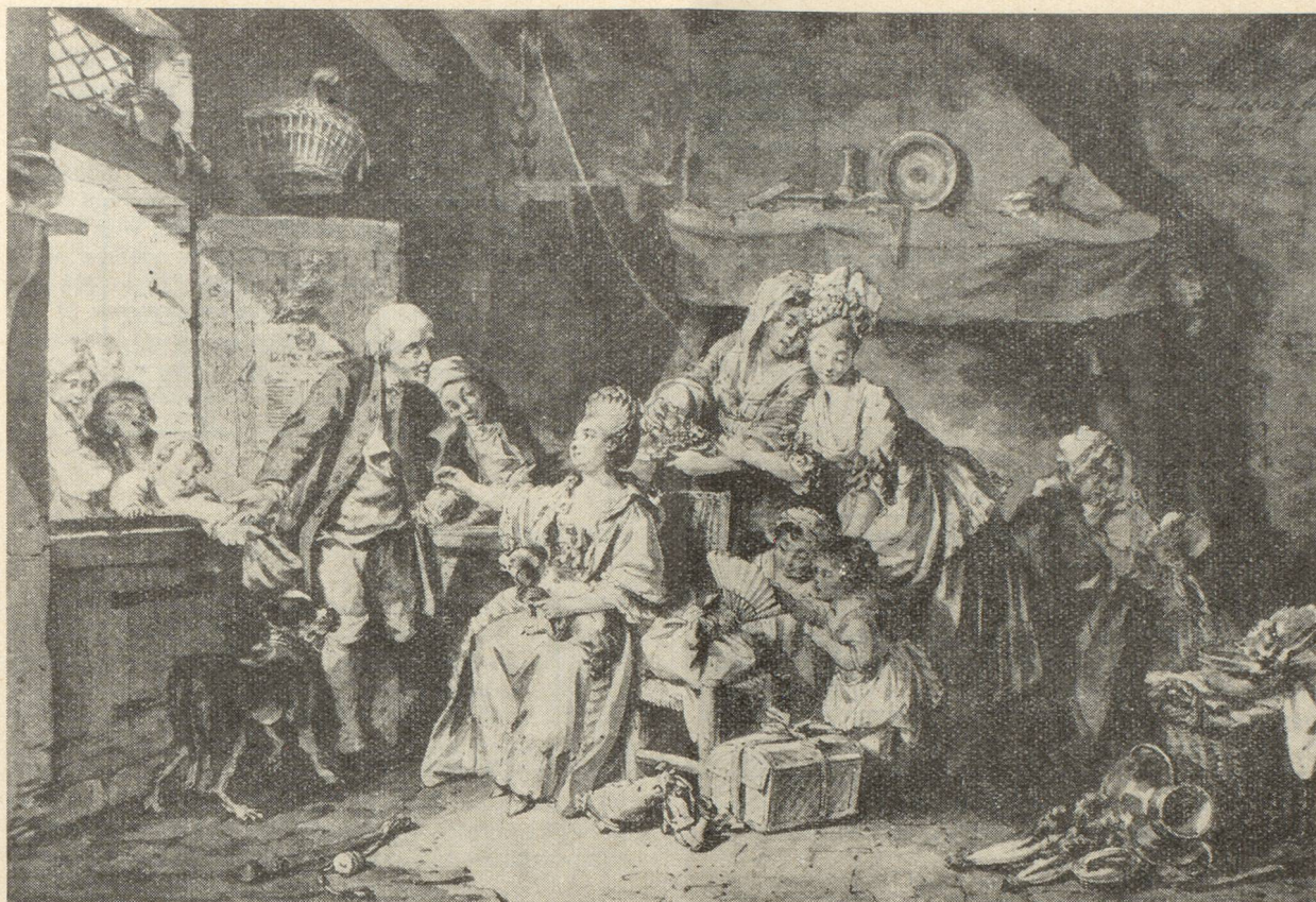
S. Freudenberger : La halle

Cependant, dans d'autres pièces, voici l'action. Il est sous-entendu que le rude labeur du paysan est la condition de son bonheur, mais c'est le bonheur qu'on nous dit. On ne représente pas l'homme au travail, labourant, fauchant ou abattant un arbre. Tout au plus le voyons-nous traire une vache, aiguïser sa faux ou apporter de l'alpe un fromage. Et quand l'image prend de l'importance, c'est aux délassements qu'on demande des sujets : un repas champêtre, une fête, un jeu. Lory-le-fils illustre celui du Lanceur de pierre et la Lutte des bergers , ou bien c'est une scène plus intime, une joie de famille, le Mariage , le Baptême , de König.